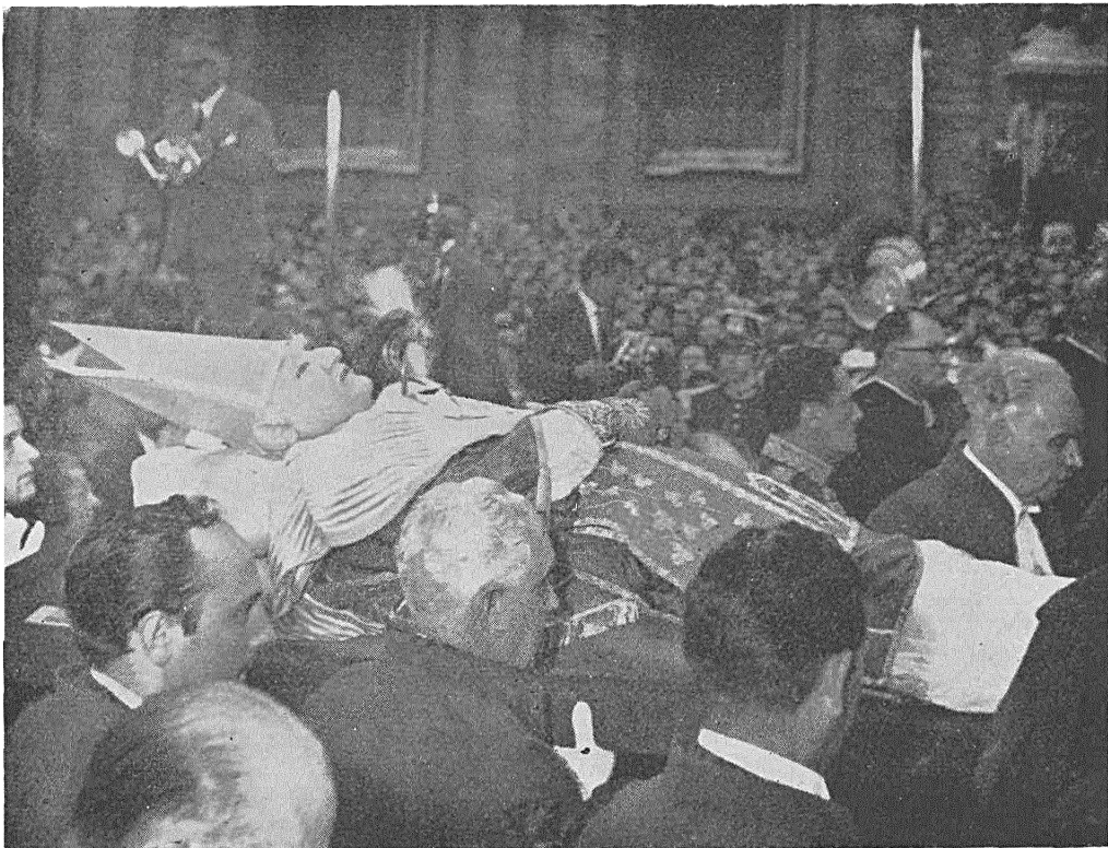
Šmiarotnyja astanki Pakojnaha Papy Jana XXIII vynosiacca na Plac pierad pachovinami

Sviatyni ũsich krajoū dy naviet vyznanniaū adkliknulisia malitaūnym žalobnym eham. Haŭovy dziaržaŭaū dy i h ũradaū paprysłali svaje kondolencyi, vyznačajučy u krajoch publicnuju žalobu, jakuju chacieli udziejničac