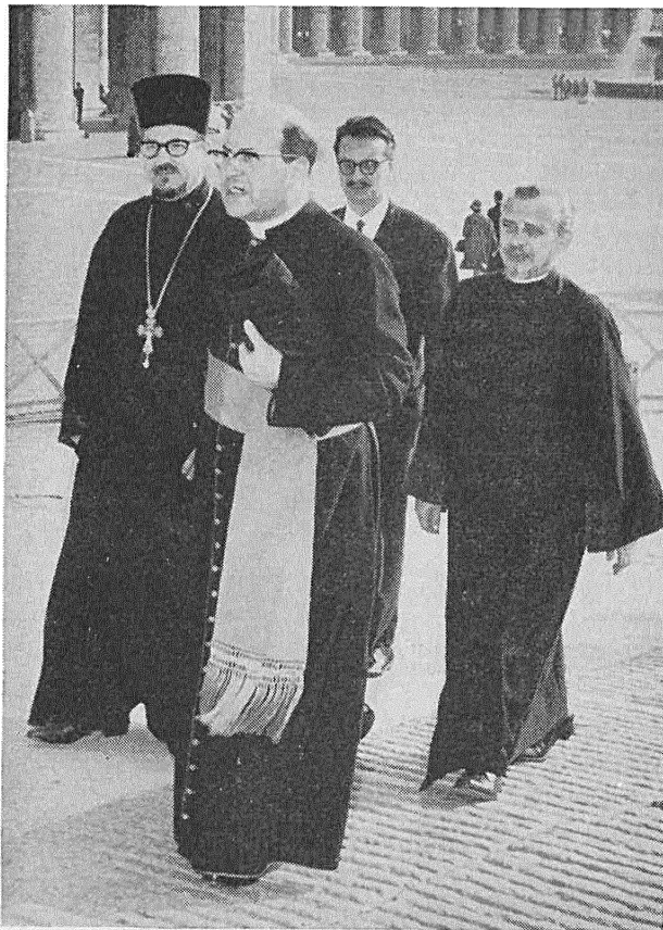
JD. Ajc Praľat Baravy - absrv. z SSSR z svajoj asystencaj

niach zysťae švietu Zbaviciela, jakija mieli pierachavać Izraelcy; a znaća ich pryznaćennje było mesyjskaje prarockaje, mieušaje pryhatović k pryjmũ Zbaviciela narody, Ź jakich paũstanie novy Izrae' Chryscijanski. Tut — jak baćymo — jošć suviaž miž starym i novym Zapavictam Božym. Narod Izraelski — jak i Apostaly navučali — byũ znaća znadobjem u Božych rukach nia tolki dla padrychtovy Adkuplennia, ale takŹa j dla vykanannia planu Zbaũlennia, zasnovy novatestamentovaj Eklezii dy razrostu jaje ũ šviecie. PieršyŹaž prapahatary jaje, Apostaly j Vućni Chrystovyja, byli Izraelcy. Tamu voš i mova na Sabory ab Izraelu, ab abnovie pašany da hetaha narodu, asabliva ũ našych časach, kali taja pašana hetak paniŹajuća byla narušanaj. Pamima haľasoũ u sušvietnaj presie,