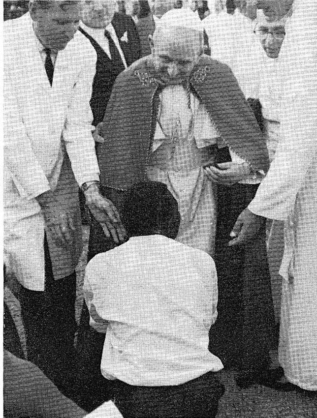
«Tamu, što vy nie mahli, dyk Papa prylacieŭ da vas...»

3-ci j apošni dzieŭ pobytu Paŭła VI ũ afrykanskaja ziamli raspačaušia kansekracyjaj aŭtarà u budujučym-sia sanktuarij Namugongo, Padčas vyjezdu z Kampali na hetuju ceremoniju tysiačnyja masy narode ovacyjami pravodzili Jaho Sviatašć dy praz usuđarohu (10 mil) ũ zaludnienych punktach vitali viu klikami j ražviejvanymi šćchami papieskimi. A Sv. Ajciec, nie akazvajučy nijakaha pieramučennia, violetiva da ich ũšmichašcia dy ajcoŭski bahasťaviŭ. U pravodnaj šćvie papskaj udziejničali takza i vysmianavannyja delehacyi Nigeryi j Bijafry... U hetym praježdzie Pavał VI na chvilinu supyniŭsia u anhl-