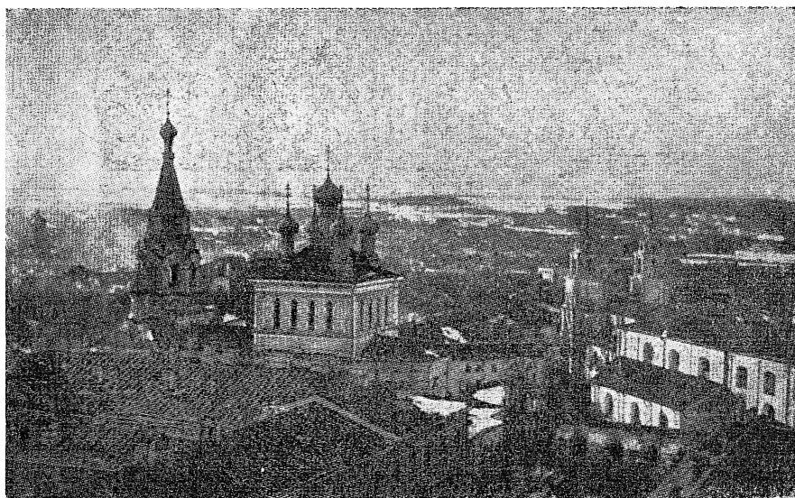
Mienskija Katedry Katalickaja j Pravasałuna ja pierad razburenniem