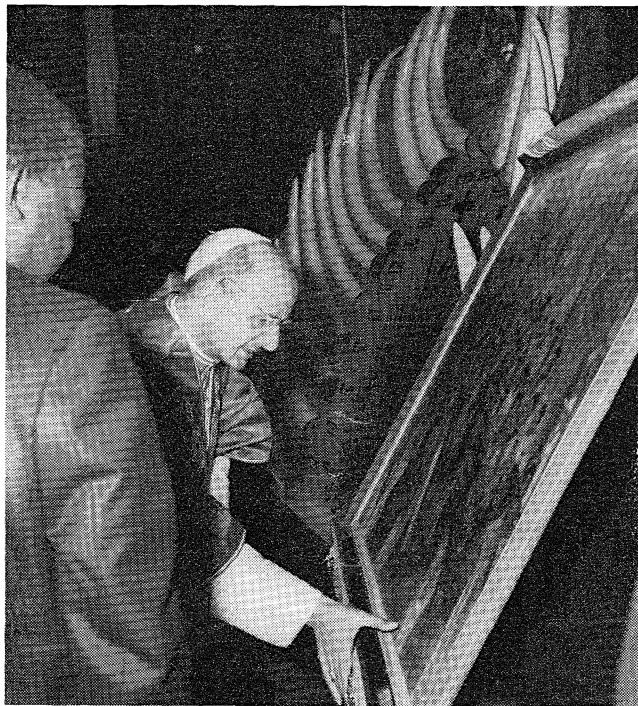
Kolki było mučanikaŭ — hetulki ślaniowych klykou u pomniku

Pa kansekracyi aŭtará ū Namugongo, Papa pry inšym, adumysłovym (na maleńkim astraŭku) adpraviŭ uračystuju Imšu = Liturhiju, padčas jakoje udzialiŭ sakramantu chrostu, kryžnavannia i Kamuniju