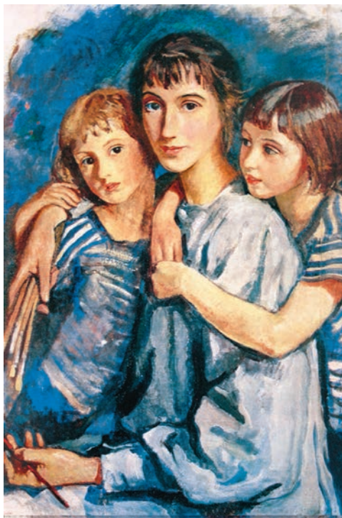
Зінаіда Серабракова. Аўтапартрэт з дзвюма дочкамі