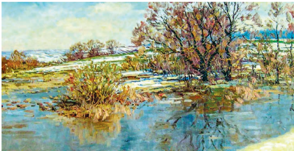
Фердынанд Рушчыц. Вясна