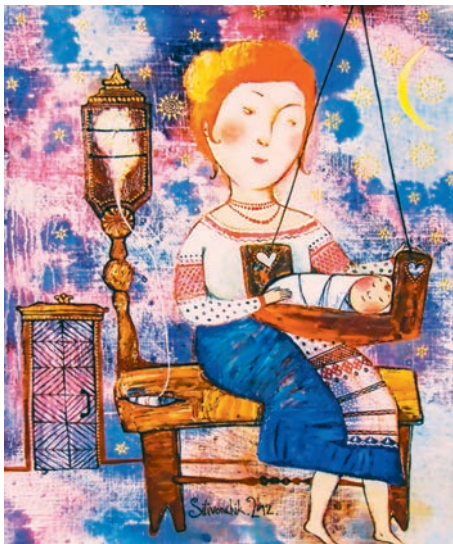
Ганна Сілівончык. Забаўлянкі для Янкі

Разгледзьце рэпрадукцыю карціны. Адкажыце на пытанні.