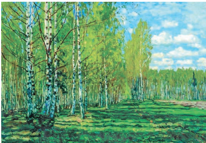
Станіслаў Жукоўскі. Лес