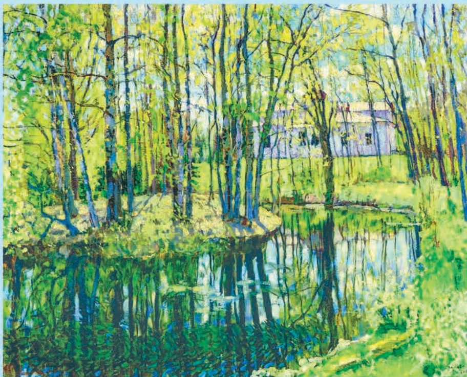
Станіслаў Жукоўскі. Вясна