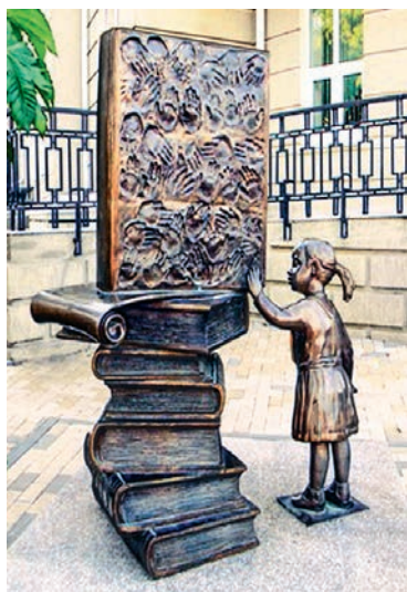
Помнік кнізе. Горад Таганрог (Расія)