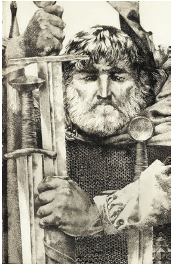
У. Лукашык. Ілюстрацыя да твора Л. Дайнекі «Меч князя Вячкі»

Вячка пацалаваў княгіню, зняў з яе шыі чорную хусцінку, шпурнуў прэч, сказаў: