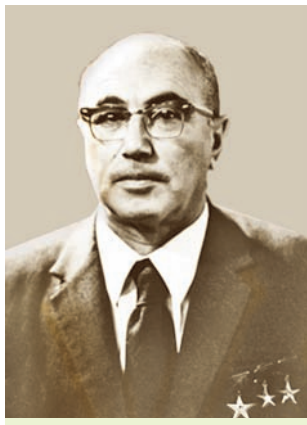
Я. Б. Зяльдовіч

**1. Адным з галоўных стваральнікаў савецкага ядзернага шчыта стаў ураджэнец Мінска, тройчы Герой Сацыялістычнай Працы Якаў Зяльдовіч (1914—1987). Чалавек, які не меў вышэйшай адукацыі, у 25-гадовым узросце стаў доктарам фізіка-матэматычных навук, вывучыўшы самастойна вышэйшую матэматыку. Гэта ўнікальны выпадак у гісторыі савецкай навукі. Займаўся даследаваннем гарэння пораху рэактыўных