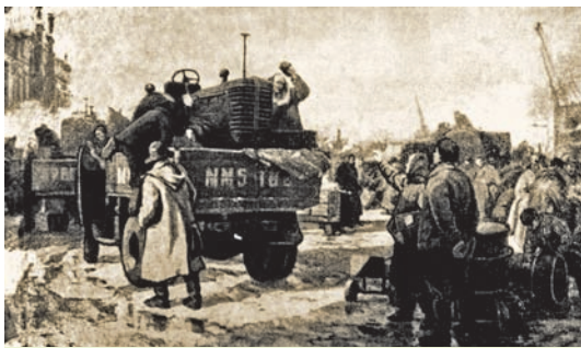
Мінскі трактарны — палям. Мастак М. Манасзон. 1957 г.