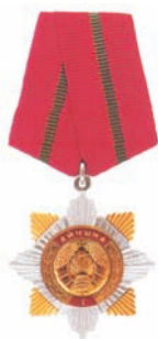
Ордэн Айчыны I-й ступені