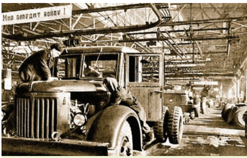
Зборка аўтамабіляў на галоўным канвееры МАЗа. Пачатак 1950-х гг.