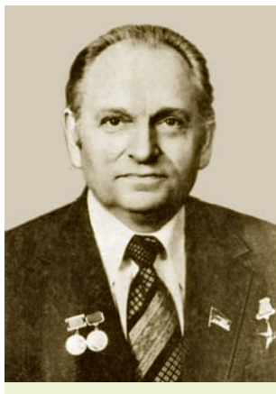
М. А. Барысевіч

Беларуская навука развівалася як састаўная частка агульнасаюзнай. Вядучая роля ў яе развіцці належала Акадэміі навук БССР, якую ўзначальваў у 1969—1987 гг. М. А. Барысевіч. Па пэўных навуковых кірунках рэспубліка дасягнула вялікіх поспехаў. За распрацоўкі ў галіне матэматыкі, фізікі, электронна-вылічальнай тэхнікі, біялогіі, медыцыны многія вучоныя сталі лаўрэатамі Ленінскай і Дзяржаўных прэмій СССР і БССР, 12 з іх былі ўдастоены звання Героя Сацыялістычнай Працы. Так, ураджэнец Магилёўшчыны акадэмік АН БССР М. Я. Мацапура стаў лаўрэатам Ленінскай прэміі за распрацоўку і ўкараненне ў сельскагаспадарчую вытворчасць высокаэфектыўных тэхналогій механізаванага асваення забалочаных зямель і ўборкі бульбы. Званне Героя Сацыялістычнай Працы было прысвоена мінчанцы, члену-карэспандэнту АН БССР, выдатнаму хірургу-афтальмолагу, таленавітаму вучонаму ў галіне вочных хвароб Т. В. Бірыч. Героем Сацыялістычнай Працы стаў Г. А. Ілізараў, які нарадзіўся на тэрыторыі сучаснай Брэстчыны. Акадэмік АН СССР, вядомы ва ўсім Савецкім Саюзе хірург-артапед, ён распрацаваў універсальны апарат фіксацыі для лячэння пераломнаў і дэфармацый касцей. У хімічнай навуцы найбольш важнымі былі дасягненні ў галіне палімераў, якія з'явіліся асновай для атрымання пластыку і сінтэтычных валокнаў. У біялогіі асаблівае значэнне мелі адкрыцці ў галінах генетыкі і геннай інжынерыі,