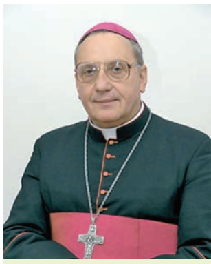
Архіепіскап Мітрапаліт Мінска-Магілёўскі Тадэвуш Кандрусевіч

каталіцкай царквой. Наладжванню канфесійнага праваслаўна-каталіцкага дыялогу спрыяе дзейнасць ураджэнца Гродзеншчыны Архіепіскапа Мітрапаліта Мінска-Магілёўскай архіепархіі-мітраполіі, Апостальскага Адміністратара Пінскай рымска-каталіцкай епархіі Тадэвуша Кандрусевіча.