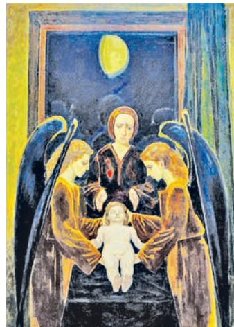
Чарнобыльская мадонна. Мастак М. Савіцкі. 1986—1990 гг.

У ліпені 1986 г. Вярхоўны Савет БССР прызнаў усю тэрыторыю Беларусі зонай экалагічнага бедства. Аднак першапачаткова ў БССР не распаўсюджвалася інфармацыя аб аварыі, і грамадства не ведала маштабаў катастрофы і не ўяўляла небяспекі, якую несла ў сабе радыяцыя. Толькі ў 1989 г. з інфармацыі аб радыяцыйным становішчы ў Беларусі быў зняты рэжым сакрэтнасці.