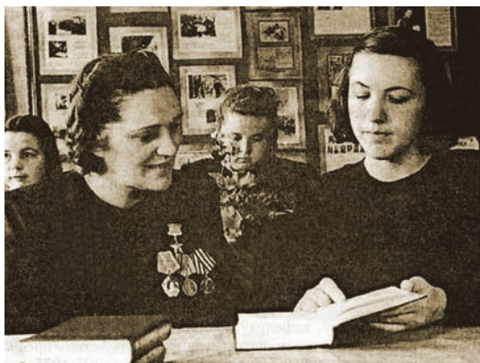
Герой Савецкага Саюза А. Р. Мазанік (злева на фотаздымку), студэнтка бібліятэчнага факультэта Мінскага педагагічнага інстытута імя А. М. Горкага, разам з аднакурснікамі рыхтуецца да заняткаў у кабінце марксізму-ленінізму. 1952 г.

Пасля вайны ў Беларусі хуткімі тэмпамі аднаўлялася матэрыяльна-тэхнічная база навукі. У 1944 г. узнавіла сваю дзейнасць Акадэмія навук БССР. У яе складзе ствараліся новыя навукова-даследчыя інстытуты: механізацыі і электрыфікацыі сельскай гас-