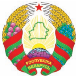
Дзяржаўны герб Рэспублікі Беларусь

У 1995 г. былі зацверджаны дзяржаўныя ўзнагароды Рэспублікі Беларусь, у тым ліку Палажэнні аб званні «Герой Беларусі», ордэнах Айчыны, Францыска Скарыны. Першым Героем Беларусі стаў у 1996 г. ваенны лётчык Уладзімір Карват. Цаной уласнага жыцця ён адвёў палаючы самалёт убок ад в. Вялікае Гацішча