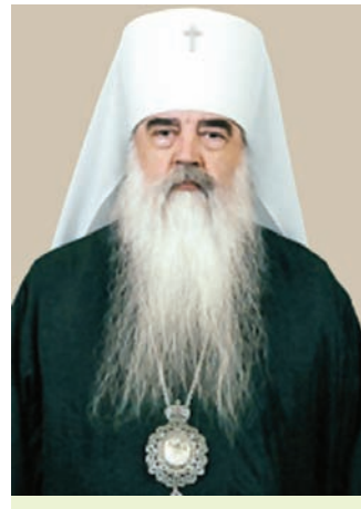
Мітрапаліт Мінскі і Слуцкі, Патрыяршы Экзарх усяе Беларусі Філарэт

Акрамя праваслаўнай, актыўна дзейнічаюць такія традыцыйныя канфесіі, як рымска-каталіцкая, пратэстанцкая, уніяцкая, іўдзейская, мусульманская і інш. З 1988 г. пачалася рэгістрацыя каталіцкіх парафій як у заходніх, так і ва ўсходніх раёнах Беларусі. Рымска-каталіцкай царкве былі вернуты адабраныя раней дзяржавай культавыя будынкі, узрасла агульная колькасць дзеючых касцёлаў. Кіруючымі структурамі Рымска-каталіцкай царквы ў Беларусі сталі створаныя Папам Рымскім Янам Паўлам II Гродзенская, Пінская, Мінска-Магілёўская, Віцебская дыяцэзіі (**4). У 1996 г. адбылося адкрыццё першага Сінода Рымска-каталіцкай царквы ў Беларусі. У стадыі абмеркавання знаходзіцца праект Пагаднення паміж Беларуссю і Святым Прастолам, што дазволіць нашай краіне ў поўнай меры супрацоўнічаць з Рымска-