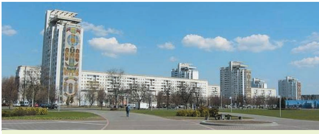
Мінск. Мікрараён Усход

рыі тыпавых праектаў. У 1970—1980-я гг. на аснове індустрыяльнага буйнапанельнага домабудавання створаны новыя жылыя раёны з высокімі архітэктурна-планіровачнымі і кампазіцыйнымі характарыстыкамі.