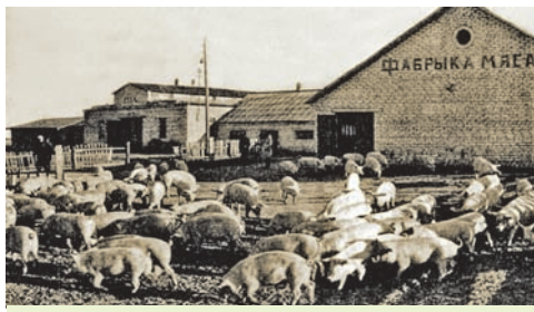
Свінагадоўчая ферма ў калгасе «Чырвоная змена» Любанскага раёна Мінскай вобласці

Сельская гаспадарка ў БССР спецыялізавалася на развіцці мясной і малочнай жывёлагадоўлі, вытворчасці бульбы, ільну-даўгунцу, цукровых буракоў. У рэспубліцы ў другой палове 1960-х гг. разгарнулася будаўніцтва буйных механізаваных ферм, комплексаў па адкорме буйной рагатай жывёлы і птушкафабрык. Працягвалася меліярацыя. Было асушана каля 1 млн га зямельных плошчаў. Аднак каля 1/3 усіх меліяра-