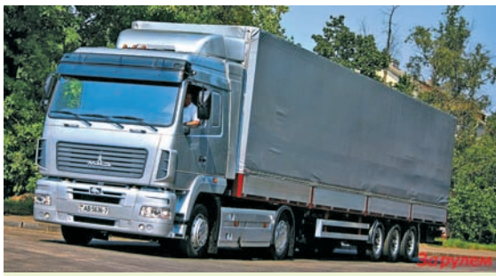
Магістральны грузавік «МАЗ»