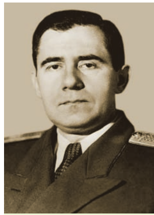
А. А. Грамыка. Другая палова 1940-х гг.

**2. У сувязі з выходам БССР на міжнародную арэну ў якасці адной з дзяржаў — заснавальніц ААН у 1951 г. быў зацверджаны новы Дзяржаўны сцяг рэспублікі. Малюнак сцяга, распрацаваны мастаком М. Гусевым, складаўся з дзвюх гарызантальна размешчаных палос. Верхняя паласа была чырвонага колеру, ніж-