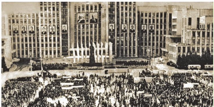
Мітынг, прысвечаны 100-годдзю з дня нараджэння У. І. Леніна. Мінск. 1970 г.

У адпаведнасці з новай Канстытуцыяй узрасла роля грамадскіх арганізацый. Колькасць іх удзельнікаў значна павялічылася. Напрыклад, камсамол Беларусі ў 1972 г. аб’ядноўваў у сваіх радах больш за 1 млн маладых людзей. Гэта адпавядала ідэалогіі «развітога сацыялізму», якая азначала адмаўленне ад нерэальных планаў будаўніцтва камунізму да 1980-х гг. і тэзіса аб адміранні дзяржавы. У той жа час напрамак руху да камунізму