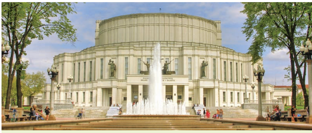
Будынак Нацыянальнага акадэмічнага Вялікага тэатра оперы і балета Рэспублікі Беларусь

Шырокую вядомасць набыў Дзяржаўны канцэртны аркестр Беларусі пад кіраўніцтвам М. Фінберга. У ім сабраны лепшыя музыканты краіны. Галоўны кірунак творчасці калектыву звязаны з адраджэннем музычнай спадчыны і папулярызацыяй беларускай музыкі.