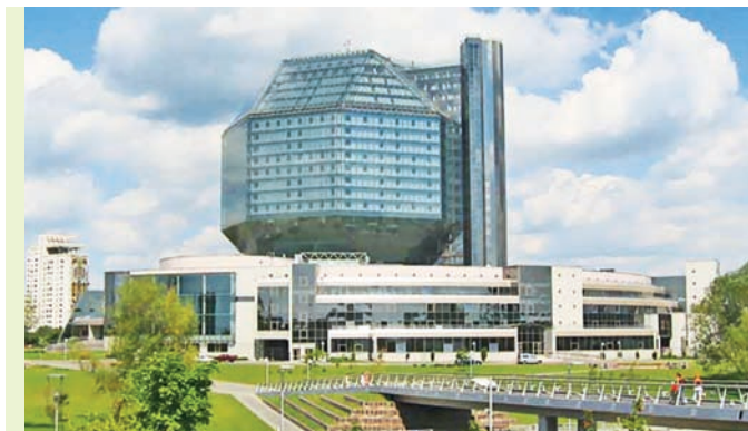
Будынак Нацыянальнай бібліятэкі Беларусі

Будынак Нацыянальнай бібліятэкі Беларусі ўяўляе сабой сапраўдны Храм кнігі. Пачынаецца ён са своеасаблівых «крылаў» — двух вялікіх рэльефаў, якія ўсталяваны па абодва бакі ад галоўнага ўвахода. Разам з помнікам Ф. Скарыну яны складаюць адзіны кампазіцыйны ансамбль. На крылах — заклік беларускага і ўсходнеславянскага першадрукара