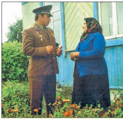
У. В. Кавалёнак з маці