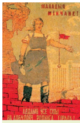
Плакат «Маладыя мінчане! Аддадзім усе сілы на адбудову роднага горада!». 1945 г.

У першай палове 1950-х гадоў было пераадолена адставанне лёгкай і харчовай прамысловасці. У 1955 г. выраблена ў 2 разы больш тавараў народнага ўжытку, чым у 1950 г.