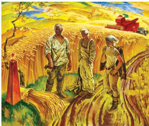
Спадчына. Мастак М. Данцыг. 1973 г.