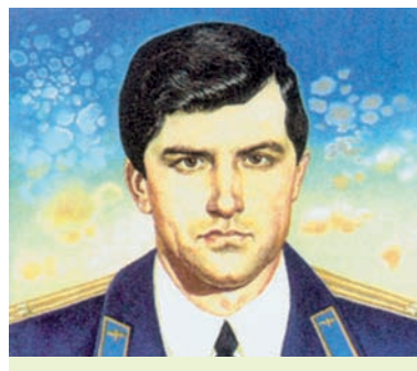
У. М. Карват

Баранавіцкага раёна і выратаваў жыцці многіх людзей. За мужнасць і гераізм, праяўленыя пры выкананні воінскага абавязку, падпалкоўнік У. М. Карват удастоены (пасмяротна) вышэйшай ступені адзнакі Рэспублікі Беларусь. Яна прысвойваецца за выключныя заслугі перад дзяржавай і грамадствам, звязаныя з подзвігам, здзейсненым у імя свабоды, незалежнасці і росквіту Беларусі. Гэта як воінская, так і працоўная ўзнагарода.