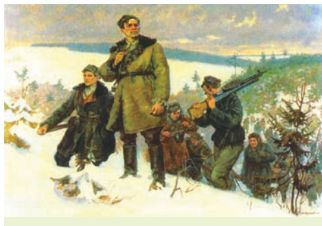
За родную Беларусь. Мастак У. Сухаверхаў. 1948 г.