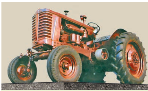
Першы колавы трактар «Беларус». 1953 г.