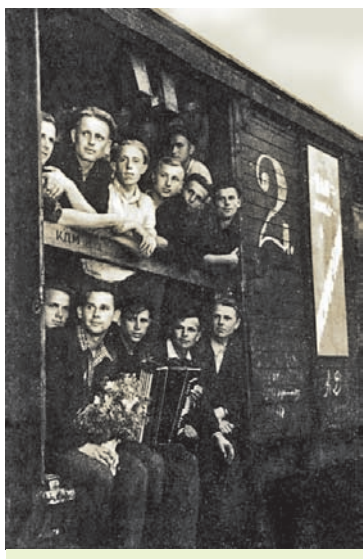
Камсамольцы з Гродзенскай вобласці ад'язджаюць на ўборку цаліннага ўраджаю. 1956 г.

Дэмакратызацыя грамадскага жыцця пасля XX з'езда партыі закранула і самую масавую ў краіне арганізацыю — прафесійныя саюзы. У іх склад уваходзіла ўсё працоўнае насельніцтва краіны, акрамя калгаснікаў. Павышэнне ролі прафсаюзаў у грамадстве было звязана найперш з пашырэннем іх вытворча-эканамічных функцый. Яны зай-