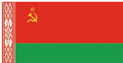
Дзяржаўны сцяг БССР. 1951—1991 гг.