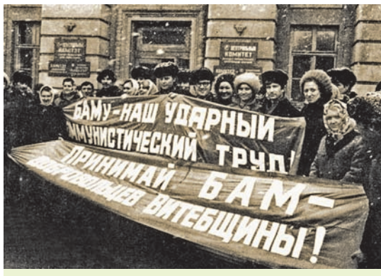
Праводзіны атрада беларускай моладзі на будаўніцтва БАМа

Паскарэнне навукова-тэхнічнай рэвалюцыі ў 1960—1970-я гг. адкрыла новыя магчымасці для ўкаранення ў сельскагаспадарчую вытворчасць дасягненняў навукі і тэхнікі. Распачалася хімізацыя сельскай гаспадаркі — унясенне ў глебу штучных угнаенняў. Аднак празмерная хімізацыя выклікала абвастрэнне экалагічных праблем (экалогія — навука аб узаемаадносінах раслінных і жывёлных арганізмаў з навакольным асяроддзем, у тым ліку ўзаемаадносінах чалавека і прыроды).