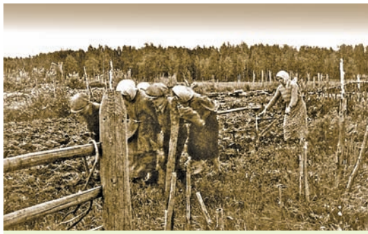
Правядзенне сельскагаспадарчых работ у першыя пасляваенныя гады

Становішча ў сельскай гаспадарцы рэспублікі было складаным. У параўнанні з даваеным перыядам у 1950 г. пасяўныя плошчы складалі 94 %. Па шэрагу паказчыкаў не ўдалося выканаць заданні пяцігодкі. Чаму так адбылося? Перш за ўсё заставалася недастатковай матэрыяльна-грашовая падтрымка калгасаў з боку дзяржавы. Не існавала і эканамічнага стымулу ў калгаснікаў, якія працавалі за працадні (адзінка ўліку працы калгаснікаў і размеркавання даходаў па працы ў калгасах у 1930—1966 гг.). Абмяжоўваўся гандаль прадуктамі, вы-