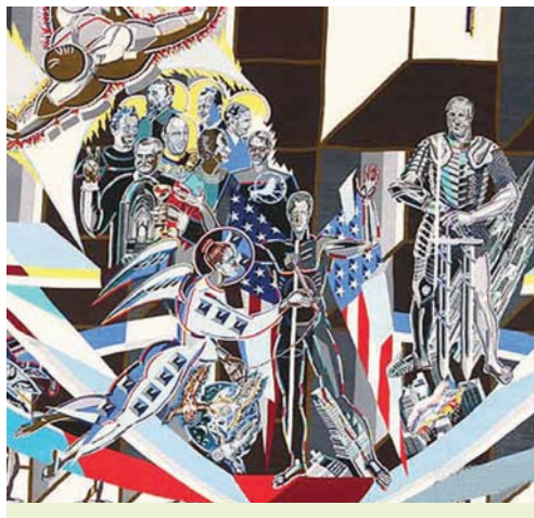
Габелен стагоддзя. Фрагмент. Мастак А. Кішчанка. 1995 г.

Значнай падзеяй у тэатральным жыцці нашай краіны стаў спектакль «Раскіданае гняздо» паводле твора Я. Купалы на сцэне Нацыянальнага акадэмічнага драматычнага тэатра імя М. Горкага. У спектаклі выяўляюцца розныя бакі беларускага характару: цяжкі лёс, сардэчнасць, мяккасць, з аднаго боку, і рашучае жаданне «людзьмі звацца» — з другога. Пастаноўка «Пане Каханку»