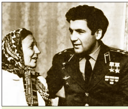
П. І. Клімук з маці

Вызначым асноўнае ў змесце нараграфу. Тое, што сярэдзіна 1950-х — 1980-я гг. былі даволі супярэчлівым перыядам у гісторыі Беларусі, не магло не адбіцца і на развіцці адукацыі і на-