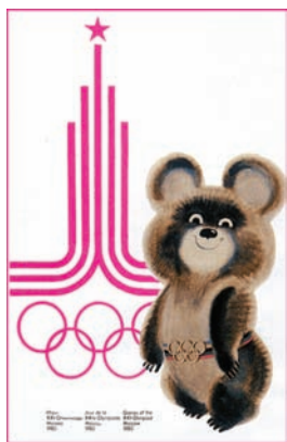
Плакат XXII летніх Алімпійскіх гульніў 1980 г. у Маскве