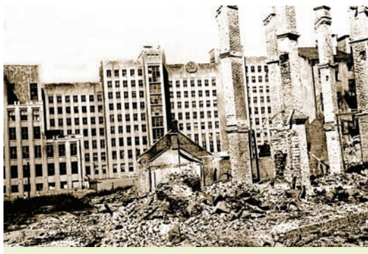
Мінск. Руіны на плошчы Леніна (цяпер плошча Незалежнасці). 1945 г.

з'яўляўся састаўной часткай агульнасаюзнага плана. Да канца чацвёртай пяцігодкі прамысловая прадукцыя БССР павінна была не толькі дасягнуць даваеннага ўзроўню, але і перавысіць яго, прычым найбольш значна па машынабудаванні, энергетыцы, торфаздабычы. Выкананне гэтай задачы ўскладнялася тым, што Беларусь не мела сваіх неабходных разведаных крыніц сыравіны (за