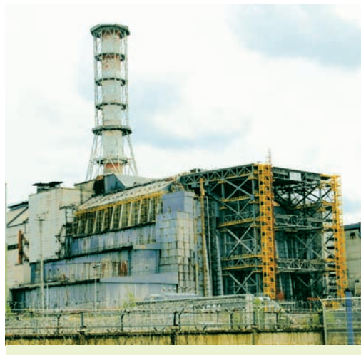
Саркафаг над разбураным энергаблокам Чарнобыльскай АЭС

Вызначым асноўнае ў змесце параграфу. Пошукі шляхоў пераадолення крызісу і забеспячэння развіцця народнай гаспадаркі БССР былі звязаны са спробамі партыйна-дзяржаўнага кіраўніцтва рэфармаваць камандна-адміністрацыйную сістэму кіравання эканомікай. Аднак сфера эканамічных адносін, якія складалі сацыялістычную сістэму гаспадарання, захоўвалася нязменнай. Гэта і стала галоўнай прычынай таго, што курс на паскарэнне сацыяльна-эканамічнага развіцця спалучаў адміністрацыйна-камандныя і гаспадарчыя метады. Укараняўся гаспадарчы разлік і самафінансаванне. Прадугледжвалася інтэнсіфікацыя вытворчасці на аснове выкарыстання дасягненняў НТР. Былі ўведзены розныя формы ўласнасці. Аднак план развіцця народнай гаспадаркі БССР не ставіў за мэту пераход да рыначных адносін. Няўдалыя спробы рэфармавання сістэмы кіравання эканомікай прывялі да далейшага нарастання негатыўных тэндэнцый. Паскорылася зніжэнне тэмпаў росту прамысловай і сельскагаспадарчай прадукцыі,