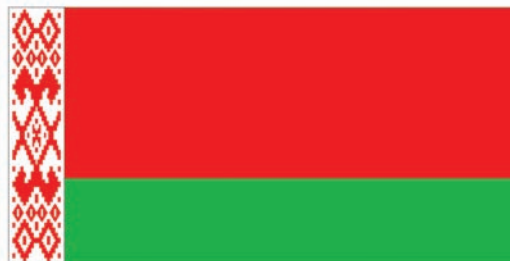
Дзяржаўны сцяг Рэспублікі Беларусь