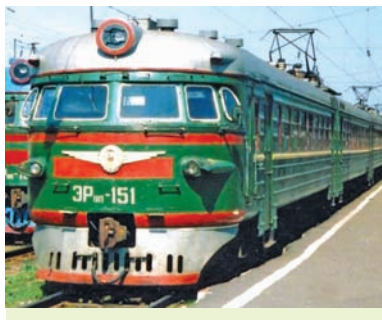
Электрапоезд на чыгуначным вакзале Мінска

рыі тыпавых праектаў. У 1970—1980-я гг. на аснове індустрыяльнага буйнапанельнага домабудавання створаны новыя жылыя раёны з высокімі архітэктурна-планіровачнымі і кампазіцыйнымі характарыстыкамі.