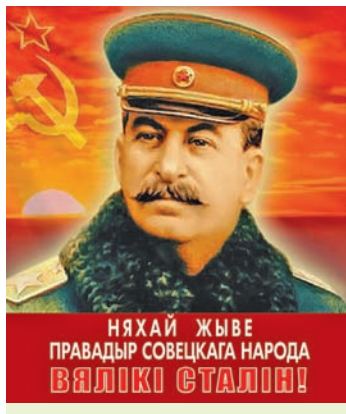
Плакат. 1950 г.

Улада з пэўным недаверам ставілася да насельніцтва, што часова пражывала на акупіраванай тэрыторыі. Насцярожанымі былі адносіны таксама да грамадзян, якія падвергліся рэпатрыяцыі , гэта значыць былых ваеннапалонных, грамадзянскіх палонных, бежанцаў і