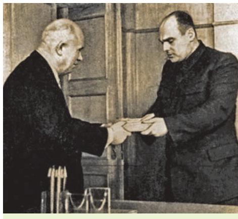
М. С. Хрушчоў уручае залаты медаль «Серп і Молат» Героя Сацыялістычнай Працы старшыні калгаса «Аснежыцкі» Пінскага раёна У. А. Ралько. 1958 г.

У пачатку 1960-х гг. адбылося пагаршэнне становішча ў сельскай гаспадарцы. На яе развіцці адмоўна адбіўся валюнтарызм у кіраванні пры М. С. Хрушчове, калі ігнараваліся аб'ектыўныя законы развіцця грамадства і вызначальнымі з'яўляліся воля і імкненне асобы кіраўніка. Калгасы і саўгасы атрымлівалі ўказанні кіруючых органаў без уліку мясцовых асаблівасцей. Так, ва ўсіх раёнах БССР, незалежна ад іх прыродна-кліматycznych умоў, прымушалі вырошчваць кукурузу. Механізацыя прывяла да значнага скарачэння колькасці коней, бо меркавалася, што як цяглавая сіла яны аджылі сваё і на змену ім прыйшло выкарыстанне трактара. Адмоўнымі былі адносіны кіраўніцтва да сялянскай падсобнай гаспадаркі, вядзенне якой фактычна забаранялася. На працягу першай паловы 1960-х гг. сярэднегадавыя тэмпы росту валавай прадукцыі сельскай гаспадаркі рэспублікі