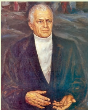
Віктар Тураў. Мастак М. Савіцкі. 1988 г.

Віктар Цімафеевіч Тураў (1936 — 1996) — ураджэнец Магілёва, беларускі кінарэжысер, народны артыст БССР і СССР. Асноўная тэматыка яго карцін звязана з адлюстраваннем дзяцінства, абпаленага вайной, сувязі ваеннага і пасляваеннага пакаленняў, барацьбы з фашызмам, сучаснасці. У кожным з 25 тураўскіх фільмаў, нават прысвечаных вайне, сцвярджаецца толькі прыгожае і добрае, як, напрыклад, у дылогіі «Вайна пад стрэхамі» і «Сыны ідуць у бой» па аднайменных раманах А. Адамовіча. Мастацкая кінастужка «Праз могілкі», знятая рэжысёрам у 1964 г., па рашэнні ЮНЕСКА праз 30 гадоў (у 1994 г.) увайшла ў лік