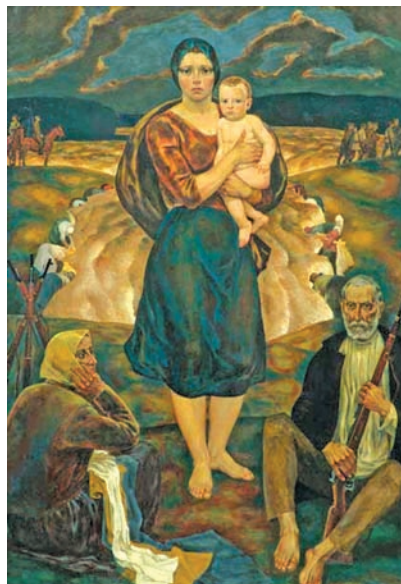
Партызанская мадонна. Мастак М. Савіцкі. 1967 г.

адлюстраванне чарнобыльскай трагедыя. Ён створаны цыкл карцін «Чорная быль», прысвечаных гэтай тэме, у тым ліку «Чарнобыльская мадонна». Цэнтральнай карцінай у цыкле «XX век» стала «Забойства праўды». Наконт яе сам мастак сказаў так: «Я пражыў складанае жыццё і вырашыў, што магу сумленна сказаць веку, які ён у маім разуменні... Мой кодэкс гонару — мае творы, у якіх я як на далоні». За больш чым 65-гадовую творчую дзейнасць мастак стварыў калекцыю патрыятычных твораў, якія сталі гонарам беларускай культуры. За свае творы мастак удастоены Дзяржаўных прэмій СССР і БССР. У 2006 г. яму першым з айчынных дзеячаў культуры прысвоена званне «Герой Беларусі». У Мінску ў 2012 г. расчыніла свае дзверы для глядачоў мастацкая галерэя М. Савіцкага.