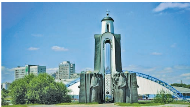
Храм-помнік загінуўшым у войнах. «Востраў мужнасці і смутку» ў Мінску

Першым у Афганістан увайшло падраздзяленне, якое лічылася адным з лепшых у СССР, — 103-я гвардзейская асобная паветрана-дэсантная дывізія, што з 1947 г. базіравалася ў Віцебскай вобласці (цяпер мабільная брыгада спецыяльнага прызначэння). За выкананне інтэрнацыянальнага абавязку дывізія была ўзнагароджана ордэнам Леніна, а восем яе байцоў сталі Героямі Савецкага Саюза. У складзе абмежаванага кантынгенту савецкіх войскаў у Афганістане служыла каля 30 тыс. беларусаў і ўраджэнцаў Беларусі. Горам і болей адгукнулася ў сэрцах