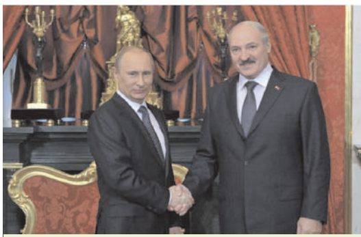
Сустрэча Прэзідэнта Рэспублікі Беларусь А. Р. Лукашэнкі з Прэзідэнтам Расійскай Федэрацыі У. У. Пуціным у час правядзення Савета калектыўнай бяспекі АДКБ. Масква, снежань, 2012 г.

гой, а іх аб'яднанне для рэалізацыі ўзаемавыгадных задач пры захаванні за Беларусь і Расіяй статусу суб'ектаў міжнароднага права.