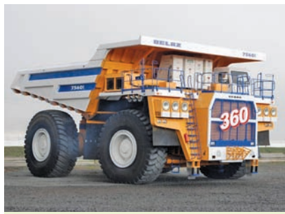
360-тонны самазвал «БелАЗ»

прамысловага комплексу нашай краіны. На працягу 22 гадоў, з 1972 па 1995 г., узначальваў аграпрамысловы калгас-каамбінат «Прагрэс» А. І. Дубко, які стаў Героем Сацыялістычнай Працы. Затым працаваў старшынёй Гродзенскага абласнога выканаўчага камітэта. За выключныя заслугі перад дзяржавай і грамадствам Аляксандр Дубко ўдастоены звання «Герой Беларусі» (пасмяротна). Званне Героя Беларусі атрымаў у 2006 г. старшыня сельскагаспадарчага вытворчага кааператыва «Прагрэс-Верцялішкі» Гродзенскага раёна В. А. Равяка, які на аснове дасягненняў свайго славітага папярэдніка вывёў прадпрыемства ў лік лепшых у краіне, ператварыўшы яго ў школу перадавога гаспадарчага вопыту. Сярод аграрыяў, удастоеных звання «Герой Беларусі» у 2001 г., быў старшыня сельскагаспадарчага прадпрыемства «Кастрычнік» Гродзенскага раёна В. І. Крамко, які ўзначальваў прадпрыемства 25 гадоў. Яго любімая фраза — «Усё пачынаецца ад зямлі». У яго быў пастаянны клопат — «каб зямля радзіла і працаўнікі жылі ў дастатку».