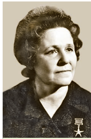
А. І. Казей

Трэба адзначыць, што развіццё адукацыі ў БССР у 1960—1980-я гг. ішло разам з паслядоўным скарачэннем беларускамоўнага навучання. У сярэдзіне 1980-х гадоў толькі 21,3 % школ працавалі на беларускай мове. На рубяжы 1980—1990-х гг. вызначылася станоўчая тэндэнцыя з укараненнем беларускай мовы ў вучэбна-выхаваўчы працэс.