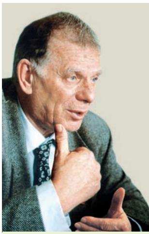
Ж. І. Алфёраў

Развіццё беларускай навукі. Стабілізацыя сацыяльна-эканамічнага становішча ў нашай краіне з сярэдзіны 1990-х гг. пачала аказваць станоўчы ўплыў на навуку. Палепшылася дзяржаўная сістэма кіравання гэтай галіной, створана сістэма падрыхтоўкі навуковых і навукова-педагагічных кадраў. Асаблівая ўвага ў апошнія гады надаецца распрацоўцы прыярытэтных навуковых кірункаў, якія садзейнічаюць развіццю навукова-тэхнічнага прагрэсу. Для гэтага ў Нацыянальнай акадэміі навук Беларусі арганізаваны інстытуты: хіміі новых матэрыялаў, малекулярнай і атамнай фізікі, Аб'яднаны інстытут праблем інфарматыкі і інш. У нашай краіне працуе адзін з лепшых на постсавецкай прасторы Цэнтр святлодыёдных і оптаэлектронных тэхналогій. Цэнтр сістэм ідэнтыфікацыі наладзіў вытворчасць інтэгральных мікрасхем для рэалізацыі метаду радыёчастотнай ідэнтыфікацыі, які ў хуткім будучым заменіць штрыхавы код, што выкарыстоўваецца ў гандлі, транспарце, медыцыне, сацыяльнай сферы ўжо на працягу 30 год. Вучоныя нашай краіны ажыццявілі шмат важных навуковых даследаванняў практычна ва ўсіх галінах ведаў.