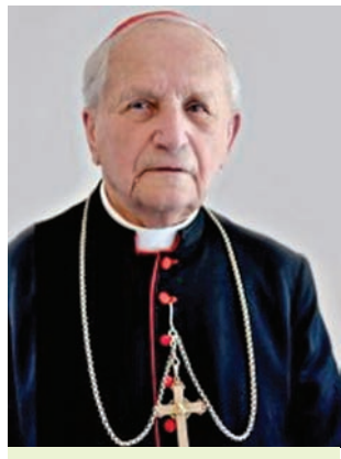
Першы беларускі кардынал Казімір Свёнтэк

Ля вытокаў адраджэння Рымска-каталіцкай царквы ў Беларусі стаяў першы беларускі кардынал Казімір Свёнтэк (1914—2011 гг.). Закончыўшы Вышэйшую духоўную акадэмію імя Фамы Аквінскага ў Пінску ў 1939 г., ён распачаў сваю службу ў Пружанах. Пасля ўз'яднання Заходняй Беларусі з БССР у час праследванняў Царквы быў арыштаваны і 2 месяцы правёў у камеры смернікаў у брэсцкай турме. Вынесены яму смяротны прысуд выканаць не паспелі — распачаліся баявыя дзеянні Вялікай Айчыннай вайны. У 1944 г. быў ізноў арыштаваны і асуджаны на 10 гадоў лагераў — на цяжкую фізічную працу, якую называлі ў тыя гады смерцю ў растэрміноўку ці сухім расстрэлам. Праводзіў тайныя службы нават знаходзячыся ў лагерах. У 1954 г. вярнуўся да дзейнасці святара ў Пінску. У 1991—2006 гг. узначальваў Мінска-Магілёўскую рымска-каталіцкую епархію,