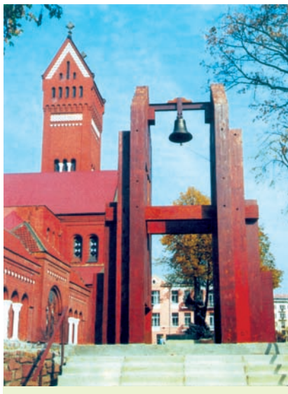
Помнік-званіца «Звон Нагасакі» як напамін аб ахвярах ядзерных катастроф. Устаноўлены перад касцёлам Святых Сымона і Алены ў Мінску

Разам з прадстаўнікамі 189 дзяржаў Беларусь у 2000 г. падпісала на саміце ў Нью-Ёрку Дэкларацыю тысячагоддзя. Гэта