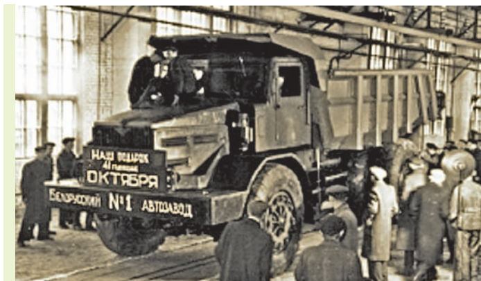
Першы самазвал, які сышоў з канвеера БелАЗа. 1958 г.

Кіраўніцтва БССР таксама ўзяло курс і на развіццё хімічнай прамысловасці. Адкрыццё вялікіх запасаў калійных солей у Салігорскім раёне дазволіла разгарнуць у рэспубліцы шырокамашабную вытворчасць мінеральных угнаенняў. Былі пабудаваны першы і другі салігорскія калійныя камбінаты, Гомельскі суперфасфатны і Гродзенскі азотна-тукавы заводы. У 1964 г. была здабыта першая прамысловая нафта ў раёне Рэчыцы. Але запасы яе аказаліся невялікімі. Таму ўласная нафта забяспечвала патрэбнасці БССР не больш як на 10 %. Астатняя частка неабходнай нафты, а таксама прыродны газ пастаўляліся па трубаправодах з Расіі, якія праз Беларусь ішлі ў краіны Еўропы. З улікам гэтага ў БССР быў пабудаваны шэраг буйных хімічных прадпрыемстваў. Сярод іх: Полацкі нафтаперапрацоўчы завод, Светлагорскі завод штуч-