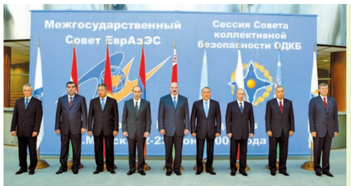
Сустрэча кіраўнікоў дзяржаў — удзельніц ЕўрАзЭС і АДКБ. Мінск, 2006 г.

У 2007 г. адбылося падпісанне Дагавора аб стварэнні адзінай мытнай тэрыторыі і фарміраванні Мытнага саюза паміж Беларуссю, Расіяй і Казахстанам. У 2010 г. у выніку шматлікіх намаганняў у межах Мытнага саюза адбылося падпісанне пакета дакументаў, якія сталі асновай