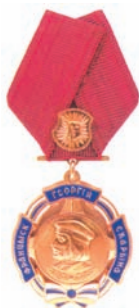
Ордэн Францыска Скарыны