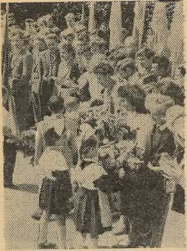
НА ЗДЫМКУ: вучні 42-й школы г. Мінска ў апошні дзень запыткаў.