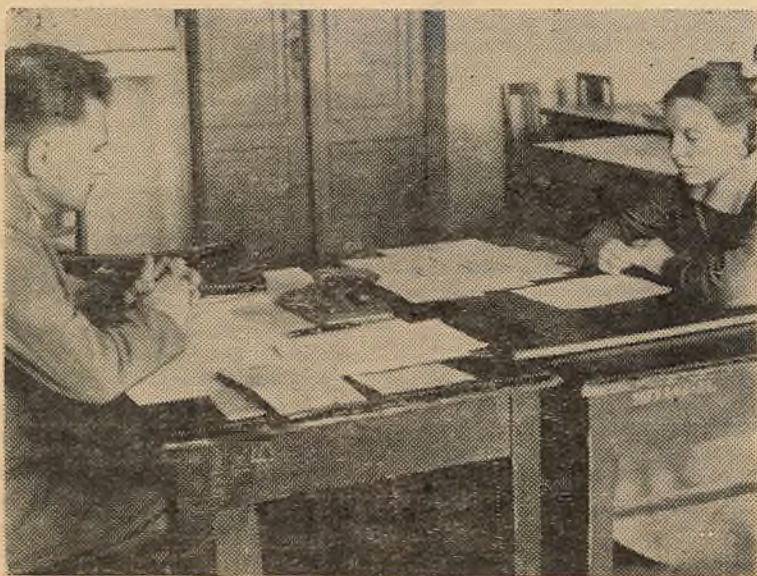
НА ЗДЫМКУ: доктар географічных навук А. Н. Андрушчанка прымае экзамен у студэнтаў першага курса геофана.