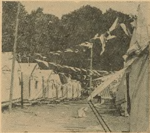
Палатачны гарадок, дзе жылі ўдзельнікі фестывалю.

Зразумела, што ўсё ўзрастаючыя папулярнасць і аўтарытэт фестывалю сярод шырокай масы моладзі свету не ўсім па душы. Рэакцыйныя сілы імперыялістычных дзяржаў, варожыя справе ўмацавання міру, нускаюць у ход увесці арсенал хуліскай буржуазнай прапаганды, прымяняюць меры эканамічнага і палітычнага прымуся моладзі, каб перашкодзіць правядзенню фестывалю, надарваць іх аўтарытэт.