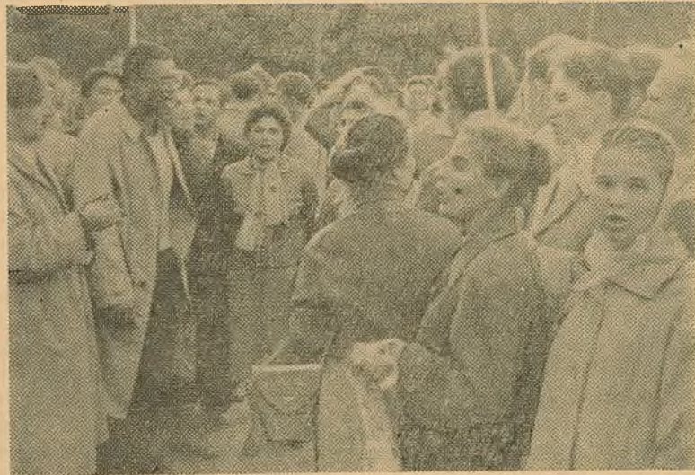
«Кацюшу» спявае савецкая і амерыканская моладзь.

Эмігранцкія друкарні ў Парыжы і Мюнхене нарыхтавалі велізарныя тыражамі антысавецкія брашуры, лістоўкі, плакаты і ўсімі спосабамі падсоувалі і падкідвалі іх удзельнікам фестывалю. З Заходняй Германіі і іншых краін