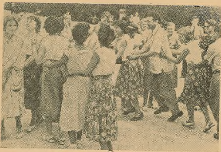
Сустрэча з чэшскай моладдзю