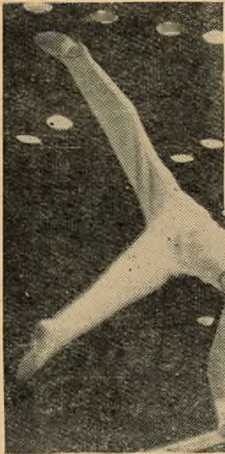
Сюдзі Цурумі выконвае практыкаванне на паралельных брусах.

тыцяй перад Рымам». Воляй жэрабя нашы спартсмены уступаюць у бой на кані. У большасці адзнака не ніжэй 9 балаў, а ў Цітова—9,45. Японцы ў гэты час выконвалі вольныя практыкаванні. Першым у іх выступаў Кенсі Цудзі. Яго