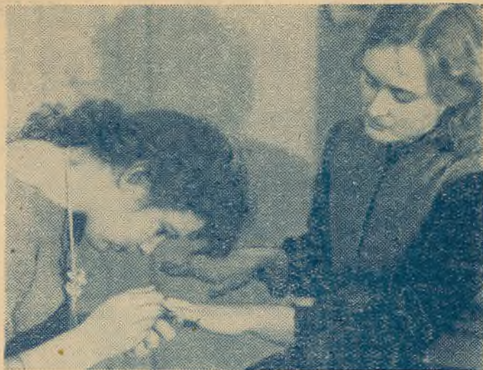
2. Як бачыце, кожнаму хочацца сустрэць Новы год ва ўсеўзбраенні. Асабліва важна гэта для дзяўчат.