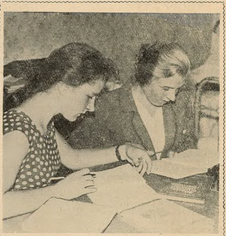
курносы нос, гарэзлівы выраз твару апошняга міжволі выклікалі ўсмешку.

— Артыст наш! — не без гордасці заўважыў Пётр. — У тэатральным, на вячэрнім займаецца.