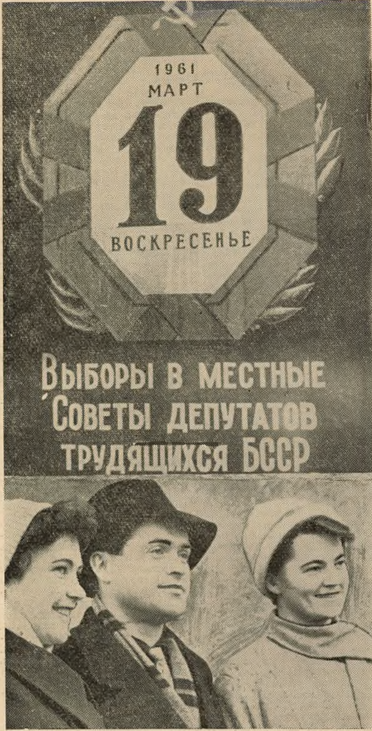
Фотаплакат М. ШОБЫ.