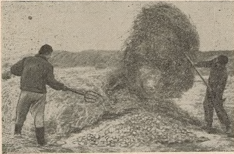
Іван Сачанка і Фелікс Ксензенка робяць яшчэ адзін бурт бульбы.

...Не вельмі часта здараецца чуць, каб пажылы чалавек называў зусім маладога хлопца па бацьку. А вось Сачанку так і называюць: Іван Іванавіч.