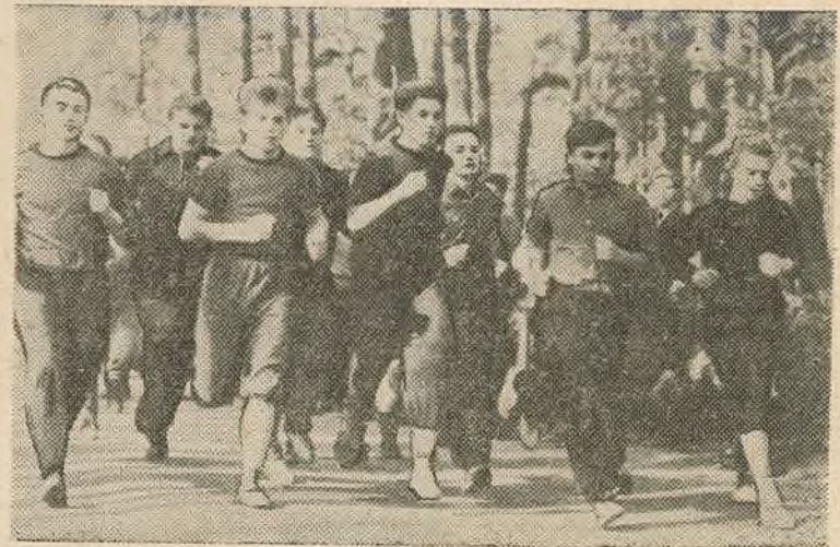
На дыстанцыі кросу — матэматыкі.

Мнагалюдна было ў цядзелю, 8 кастрычніка, у парку імя Чэлюскінцаў. Студэнты першых курсаў універсітэта сабраліся