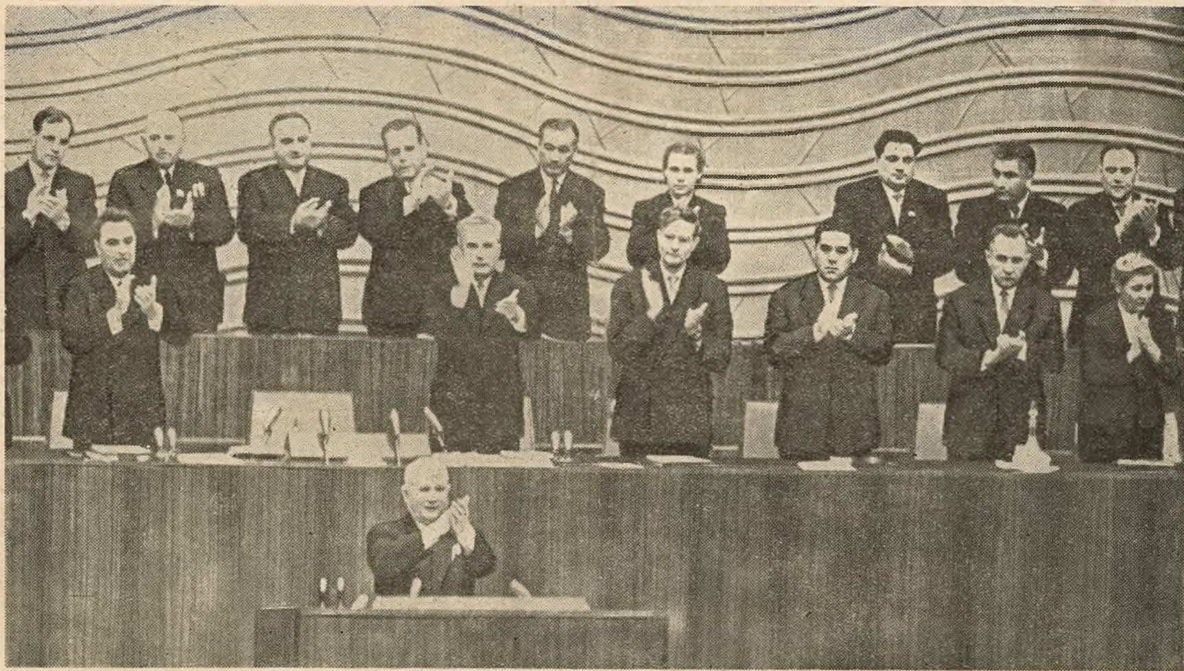
МАСКВА. 17 кастрычніка. XXII з'езд Камуністычнай партыі Савецкага Саюза. НА ЗДЫМКУ: у прэзідыуме з'езда. На трыбуне М. С. ХРУШЧОУ.