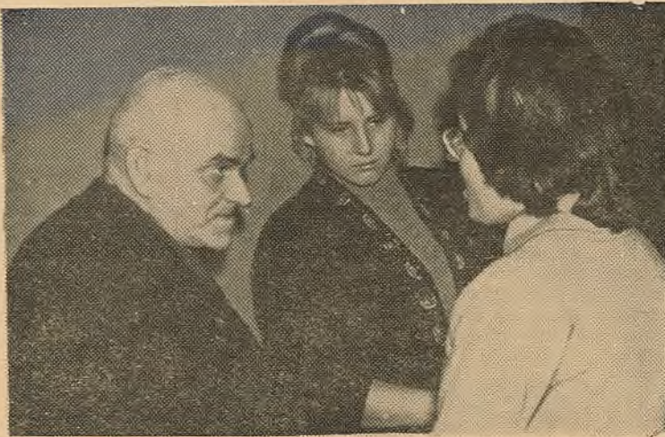
Дыскусія працягваецца і на калідоры.