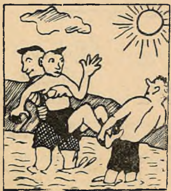
— Я ж плаваць не ўмею!