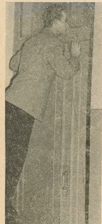
Як там трымаюцца нашы?

группы II курса географічнага факультэта, што прыйшлі здаваць экзамен па географіі раслін, хвалююцца, як некалі на першым курсе. Шасцяць старонкі падручнікаў, тэрмінова перагортваюцца кан-