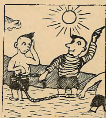
— Уперад! Не бойся!