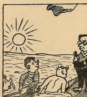
Выкладчык:—Усё ў парадку, можна паставіць добрую адзнаку.