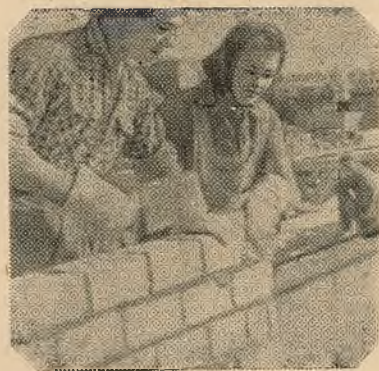
Кадр з фільма «Цаліна, вуліца Мінская».

Дыктарскі тэкст гучыць то ў лёгкім размоўным тоне, то павышаецца да публіцыстычных абагульненняў. Добрае гукавое афармленне пераклікаецца з рытмам працы.