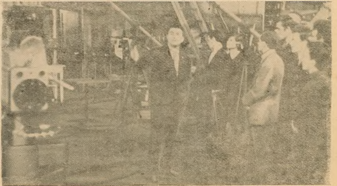
Першакурснікі аддзялення журналістыкі ў мінулыя нядзелю пабывалі на экскурсіі па Беларускай студыі тэлебачання.

га факультэта хадаінічаў перад Міністэрствам вышэйшай і сярэдняй спецыяльнай адукацыі БССР аб арганізацыі навучальнай практыкі для студэнтаў у раёне станцыі Памыслішча. Гэтае пытанне вырашана станоўча.