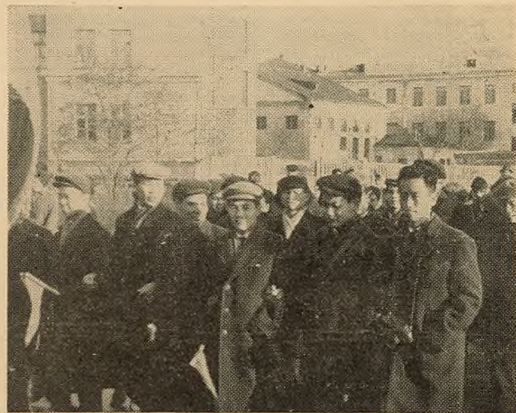
НА ЗДЫМКУ: У дружнай студэнцкай сям'і нашага ўніверсітэта — студэнты братняга В'етнама. Яны разам з усімі савецкімі народамі святкавалі 48-ю гадавіну Вялікай Кастрычніцкай сацыялістычнай рэвалюцыі.

Нядаўна перад студэнтамі-журналістамі ўніверсітэта выйшла вялікая група паэтаў-выкладчыкаў Расійскай Федэрацыі, Украіны, Латвіі, Ганіі. Яны расказалі маладым журналістам шмат цікавага аб сваёй рабоце, а таксама аб асаблівасцях перакладу беларускай мовы на іншыя.