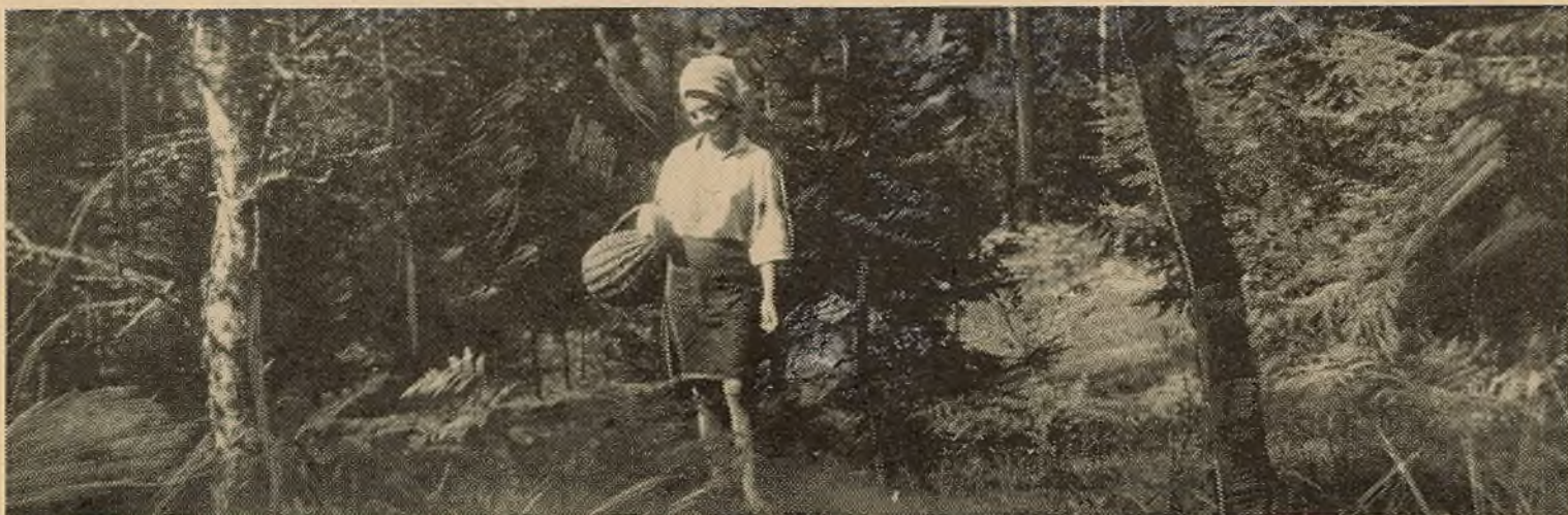
ВОСЕНЬ НЕ ГРИБНАЯ, АЛЕ...