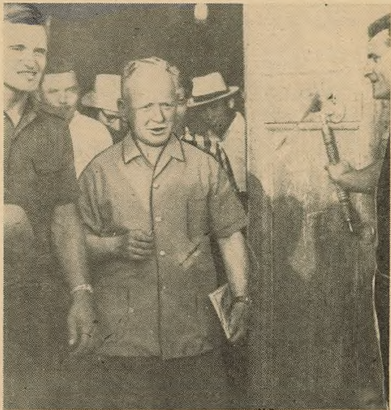
1. На доўга застаецца ў памяці студэнтаў-цаліннікаў нашага ўніверсітэта цікавая і радасная сустрэча з вядомым усяму свету пісьменнікам Міхаілам Аляксандравічам Шалахамым. Матэрыял аб гэтай сустрэчы чытайце на 4-ай старонцы.

Толькі пры ўмове, калі справаздачна-выбарчыя сходы пройдуць па-дзелавому, пры высокай актыўнасці камуністаў, яны будуць садзейнічаць далейшаму павышэнню ролі пярвічных партыйных арганізацый у вырашэнні задачы камуністычнага будаўніцтва.