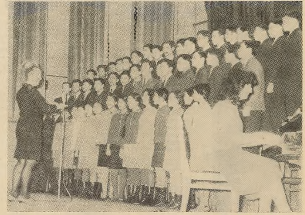
Адказны рэдактар М. І. ЮСЬКА.

НА ЗДЫМКУ: у час агляду выступае хор; дырыжор — Святлана Вінаградва, акампаніруе Галіна Гаурывава.