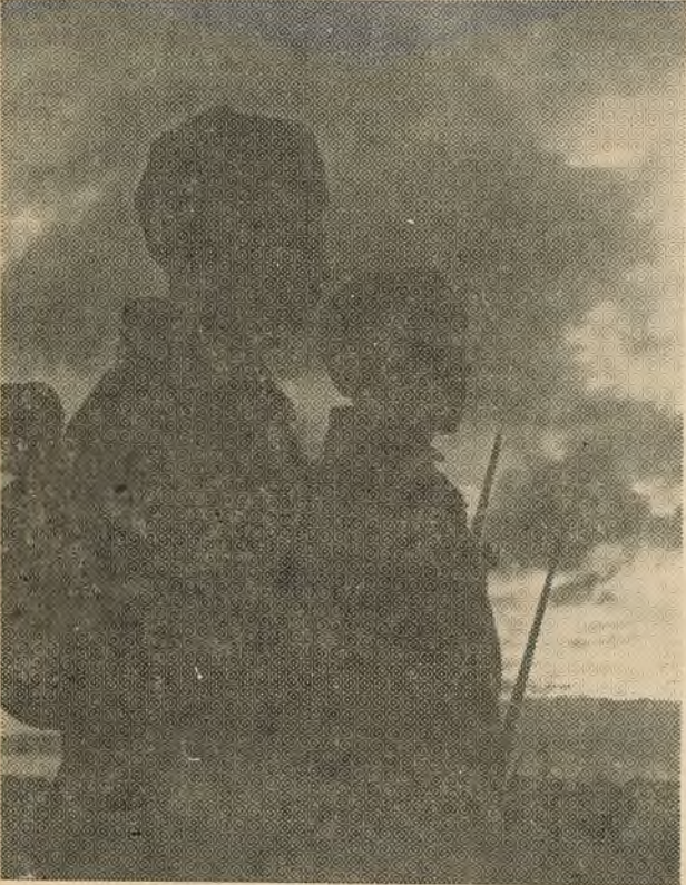
У начным дазоры.