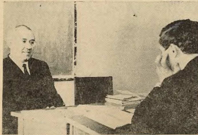
Для студэнтаў IV курса гістарычнага факультэта надышла апошняя сесія. Цяпер яны паспяхова здаюць экзамены, залікі, каб у хуткім часе прыступіць да напісання дыпломных.