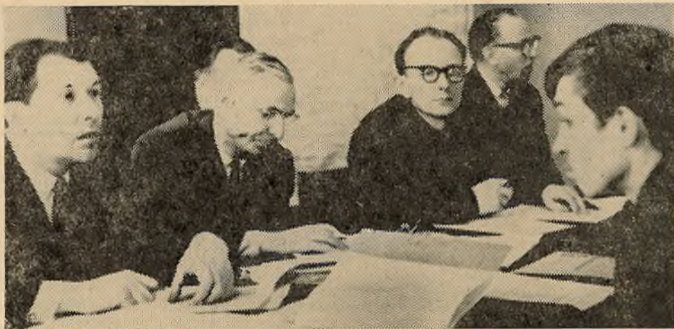
На хімфаку адбылося размеркаванне студэнтаў-выпускнікоў на працу. Большасць з іх накіравана ў раённыя цэнтры рэспублікі.