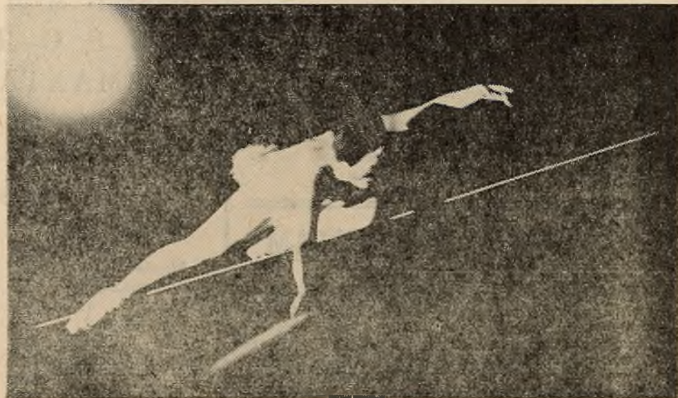
Адказы рэдактар М. ЮСЬКА.