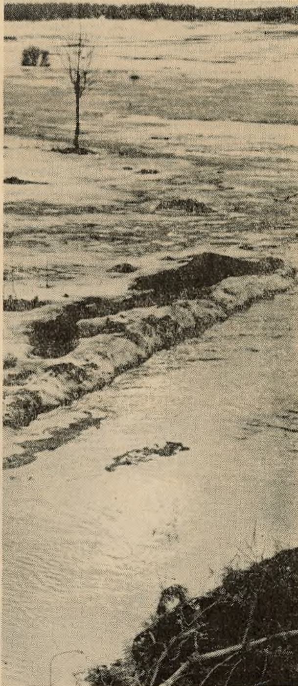
Адказы рэдактар М. ЮСЬКА.