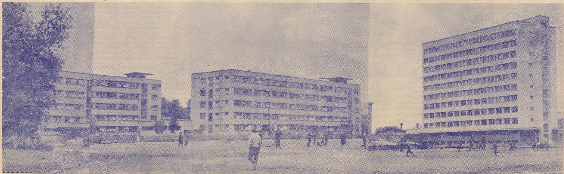
У гэтых інтэрнатах жывуць студэнты ўніверсітэта.

У БДУ штогод праводзіцца міжфакультэцкія спартыўныя спартакіяды, яго прадстаўнікі выязджаюць на спаборніцтвы ў іншыя рэспублікі і замежныя краіны.