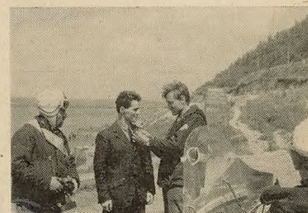
Кожны дзень паходу быў насычаны самымі разнастайнымі справамі.