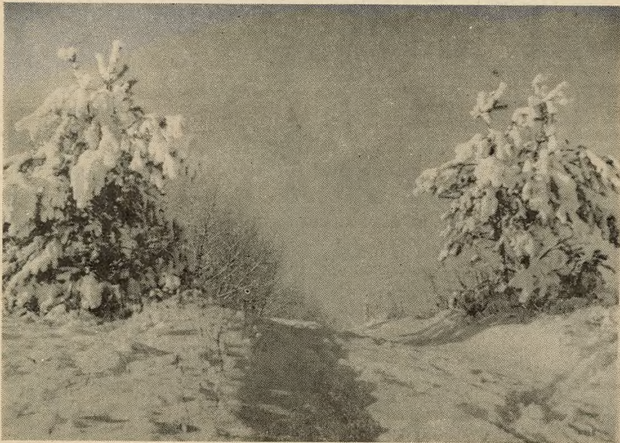
У СНЕЖНЫМ УБРАННІ.