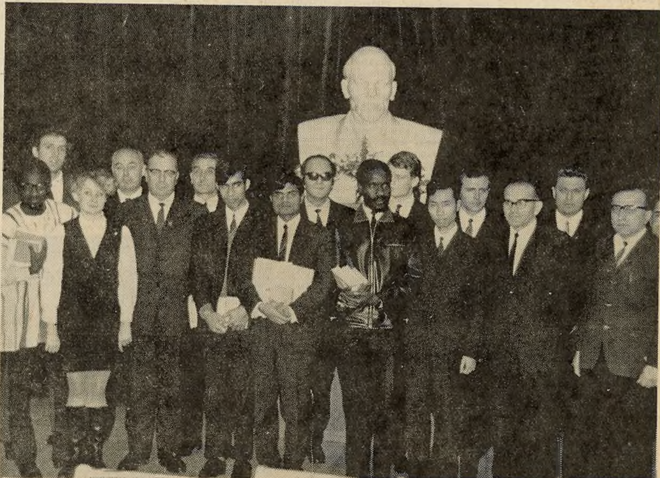
Нядаўна ва ўніверсітэце прайшла інтэрнацыянальная студэнцкая навукова-тэарэтычная канферэнцыя, прысвечаная 100-годдзю з дня нараджэння У. І. Леўіна. На здымку: удзельнікі канферэнцыі.