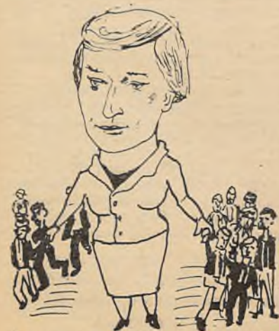
Каб грызлі штодзёчна навукі граніт, Іх трэба не меней трымаць, як магніт.

● на Е. С. Шалалёнак , куратара групы біялагічнага факультэта