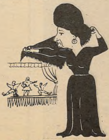
З нягодамі спрачаючыся дзейсна, Вядзе яна ўсю самадзейнасць. Мал. М. ІНІНА.

● на С. А. Лысенка , адказную за культурна-масавую работу ў парткоме БДУ