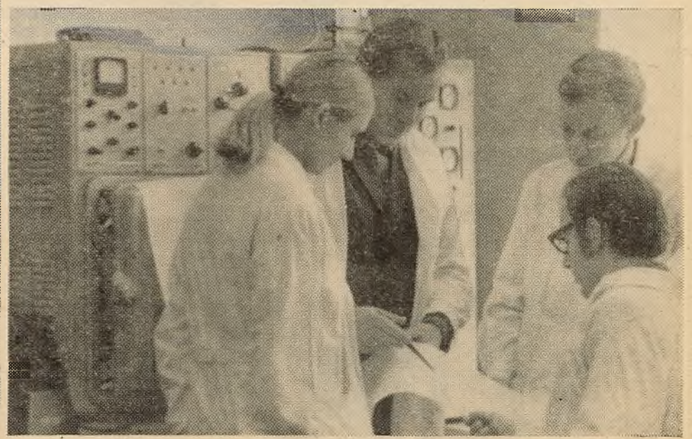
Студэнты хімічнага факультэта асвойваюць новую метадку храматаграфічных метадаў даследавання рэчываў.

Тэхнічныя сродкі праграмаванага навучання павінны адпавядаць розным патрабаванням навучальнага працэсу. Так, у выкладанні фізікі, хіміі патрэбны навучаючыя машыны, якія маглі б паказаць дынаміку з'явы, таму ў гэтых машынах пажаданы праграма кіруемы кінапраектар. Для іншых прадметаў (гісторыя, (Заканчэнне на 2-й стар.)