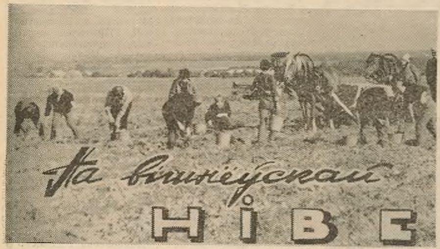
На Вішнеўскай НІВЕ

Месца падзей — вёска з прыемнай назвай Вішнеўка калгаса імя Кірава Дзяржынскага раёна.