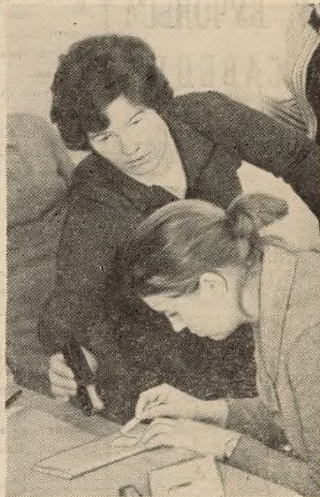
Вялікі практыкум на заалогіі пазваночных у студэнтаў VI курса аддзялення біялогіі. Тэма заняткаў: прыгатаванне дэманстрацыйных мадэляў.