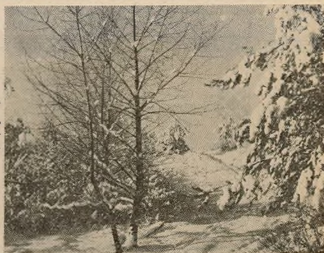
Дзень добры, доўгачапаная зіма!

Нават калі ты не адкрываў кнігу, усё роўна падымай руку на практычных і семінарскіх занятках. Праз некаторы час выкладчык вырасьць, што ты старанны студэнт, і перастане цябе выклікаць.