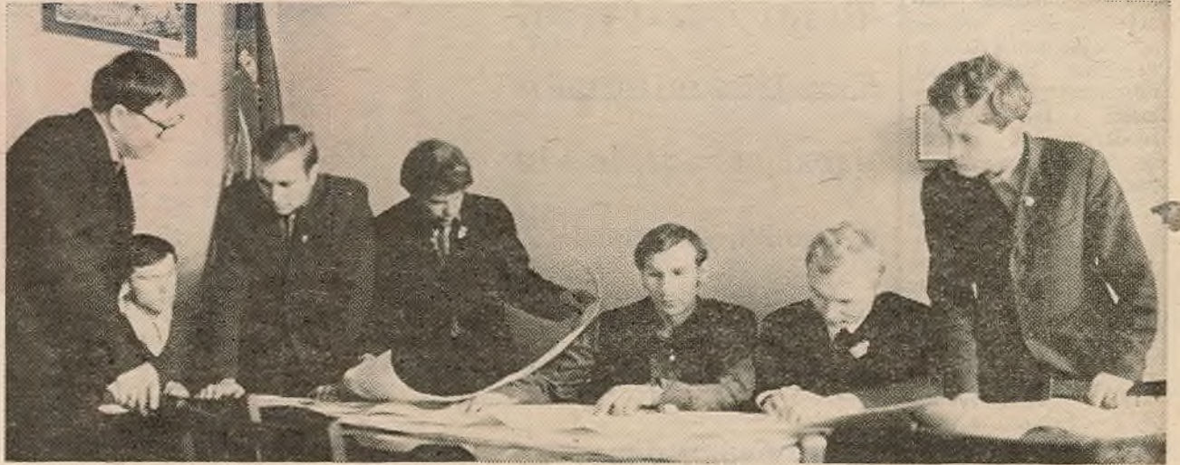
Працоўны семестр-73 прысвячаецца 50-годдзю прысваення камсамолу імя У. І. Леніна. Заканчваецца фарміраванне атрадаў. А ў начальнікаў штабаў працоўных спраў факультэтаў — новыя клопаты: пачынае сваю работу студэцкая канферэнцыя па праблемах СБА.