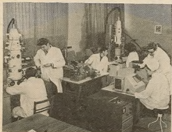
У адной з лабараторыяў хімічнага факультэта.