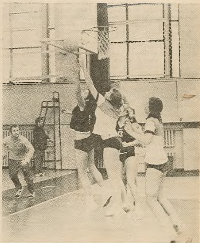
Тысячы студэнтаў універсітэта ў вольны ад вучобы час гартуюць сваё здароўе, набіраюць сілу і спрыт у імітатліх спартыўных секцыях.