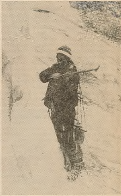
Наперад і ўверх.