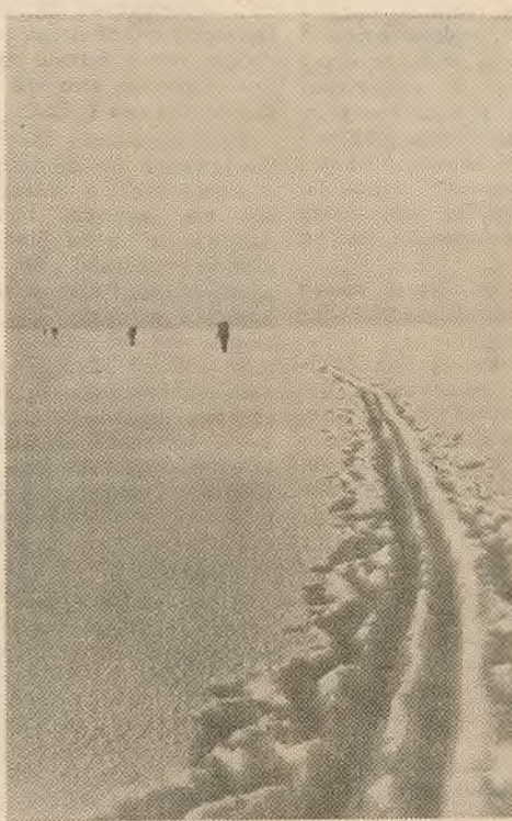
Крок у крок.

У планах клуба — новыя вяршыні. Новыя паходы, новыя перамогі. А яны немагчымы без доўгіх, настойлівых трэніровак. І таму два разы ў тыдзень сустракаюцца спартсмены ў спартыўнай зале, а па нядзелях — у ваколліцах Крыжоўкі і Зялёнага. А. ЗАЛАН.