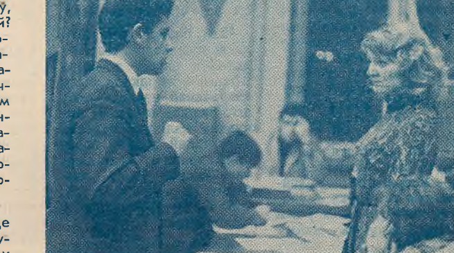
У камітэце камсамола ідзе гутарка аб насценным друку.

— Вядома, ні я, ні іншыя члены камітэта камсамола не могуць быць у курсе спраў усіх кафедраў. Але на «месцах» у нас ёсць надзейныя памочнікі — адказныя за выпуск насценных газет. Адзін раз у месяц мы збіраемся на «творчы савет». Дзелімся задумамі, абмяркоўваем надзённыя пытанні,