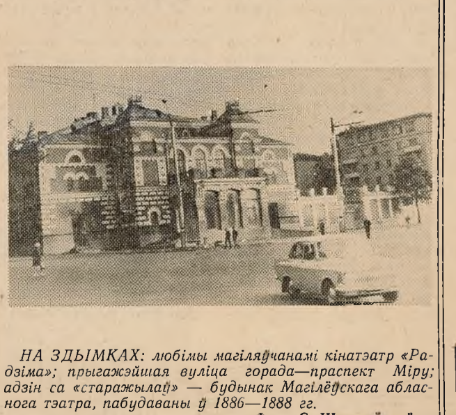
НА ЗДЫМКАХ: любімы магіляўчанамі кінатэатр «Радзіма»; прыгажэйшая вуліца горада — праспект Міру; адзін са «старажылаў» — будынак Магілёўскага абласнога тэатра, пабудаваны ў 1886—1888 гг.