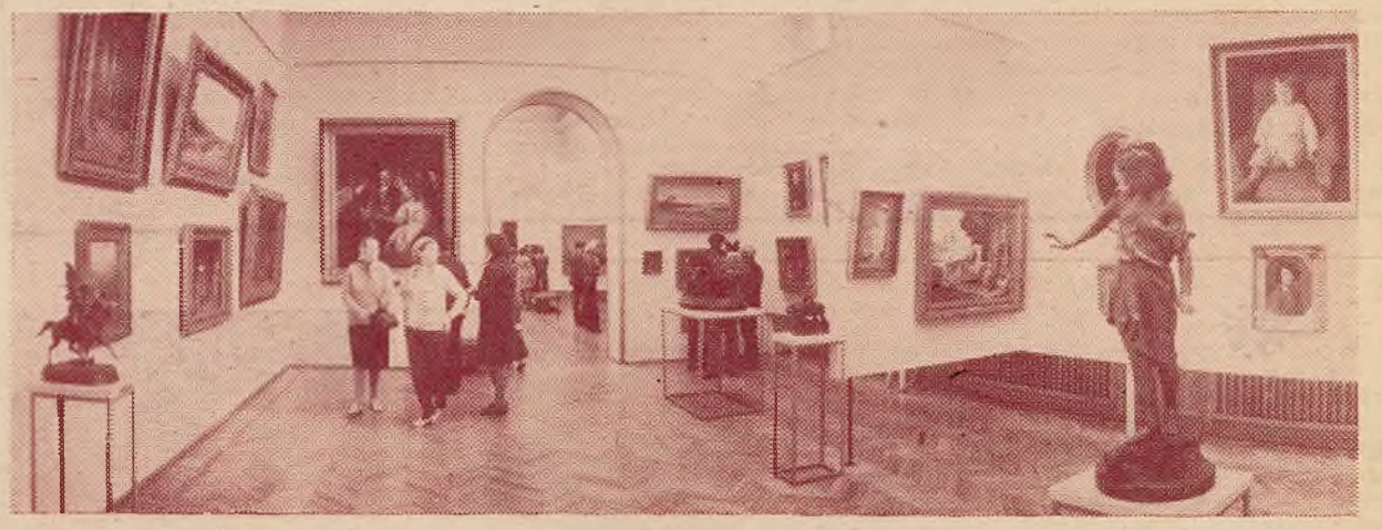
Сустрэча з прыгожым... Адно і тыя ж карціны вісяць у Дзяржаўным мастацкім музеі БССР, але кожны раз яны — іншыя, новыя, прываблівыя і чароўныя. Сёння на спатканне з высокім мастацтвам прывёў нас фотакорэспандэнт Анатоль БАСАЎ , студэнт I курса факультэта журналістыкі.