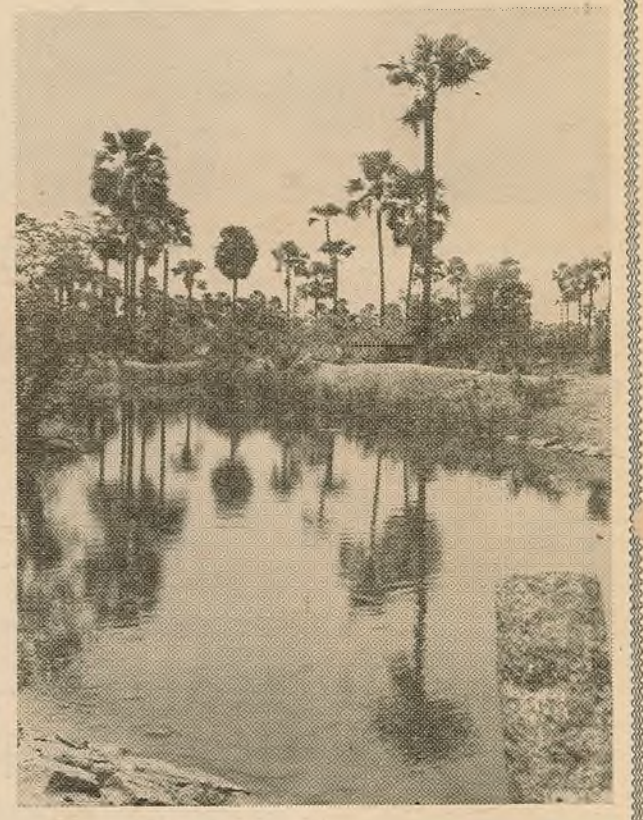
Вечназялёны поўдзень Індыі.