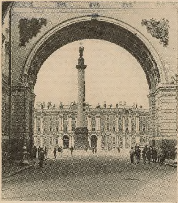
ЛЕНІНГРАД!. Гэта слова блізкае кожнаму савецкаму чалавеку. Ён здзівіў свет падзеямі 1917 года, ён і сёння здзіўляе нас сваёй прыгажосцю.