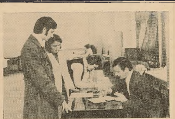
ПАЧАТАК ЛЕТА — СЕЗОН АБИТУРИЕНТАЎ. ПЕРШЫМІ ЯГО АДКРЫЛІ ЖАДАЮЧЫЯ ПАСТУПІЦЬ НА ЗАВОЧНЫ ФАКУЛЬТЭТ НАШАЙ УСТАНОВЫ. НА ЗДЫМКУ: «А КАЛІ ПАЯВЯЦЦА СПІСЫ ПАСТУПІУШЫХ!» — ЦІКАВЯЦЦА АБИТУРИЕНТЫ У ЧЛЕНАЎ ПРЫЕМНАЙ КАМІСІІ.

Жадаем вам выдатных поспехаў, цікавай практыкі, добрага адпачынку!