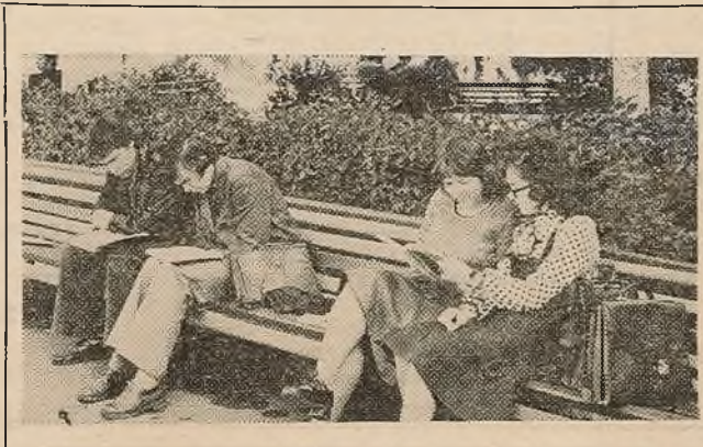
У кожнага ёсць сваё любімае месца для падрыхтоўкі.

Замкнутыя моры поўдня СССР — Каспійскае і Аральскае — прадстаўляюць сабой цікавейшыя прыродныя аб'екты, вывучэнне якіх мае першараднае навуковае значэнне.