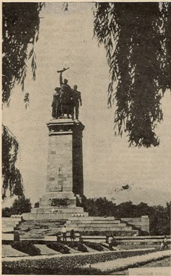
Помнік воінам Савецкай Арміі ў Сафіі.

прадугледжаны Комплекснай праграмай сацыялістычнай эканамічнай інтэграцыі краін — членаў СЭУ. У прыватнасці, яна ўдзельнічае ў будаўніцтве газавога, па якому арэнбургскі газ ад берагоў Урала будзе дастаўляцца ў 6 дзяржаў — членаў СЭУ, у тым ліку і Балгарыю.