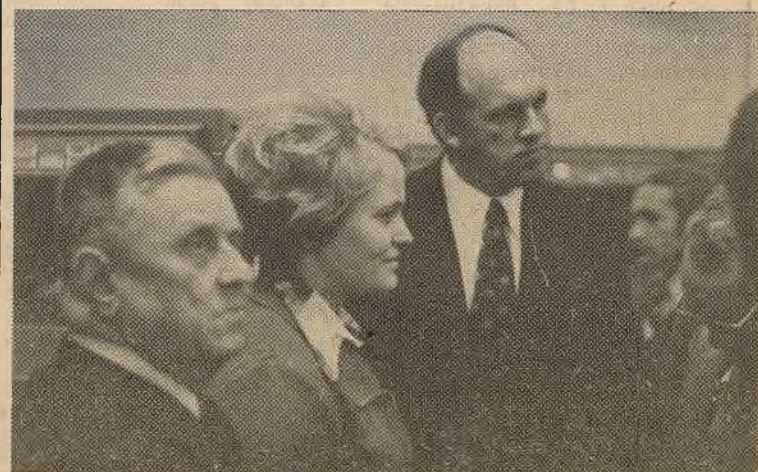
Наш ўніверсітэт наведваў міністр вышэйшай адукацыі Рэспублікі Куба Фернанда Бесіна Алігрэт, які знаходзіўся некаторы час у Саветскім Саюзе.

Рэдакцыі газеты «Беларускі ўніверсітэт» шырока асвятляць на сваіх старонках пытанні развіцця крытыкі, самакрытыкі, падварагаць крытыцы недахопы ў жыцці ўніверсітэцкага калектыву і дабівацца своечасовага рэагавання на крытычныя выступленні.