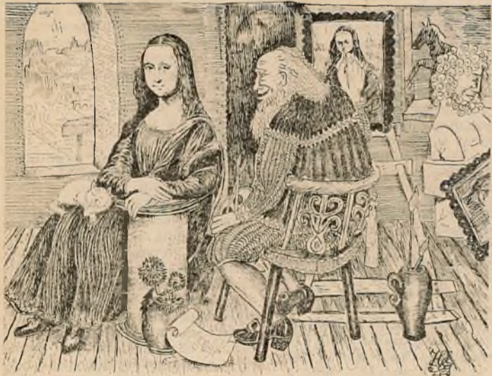
— А цяпер, сін'ера Мона Ліза, яшчэ адзін анекдот з жыцця свецкіх жанчын...

БЕСЦЫРЫМОННАСЦЬ — літаральна «абыходжанне без цы-