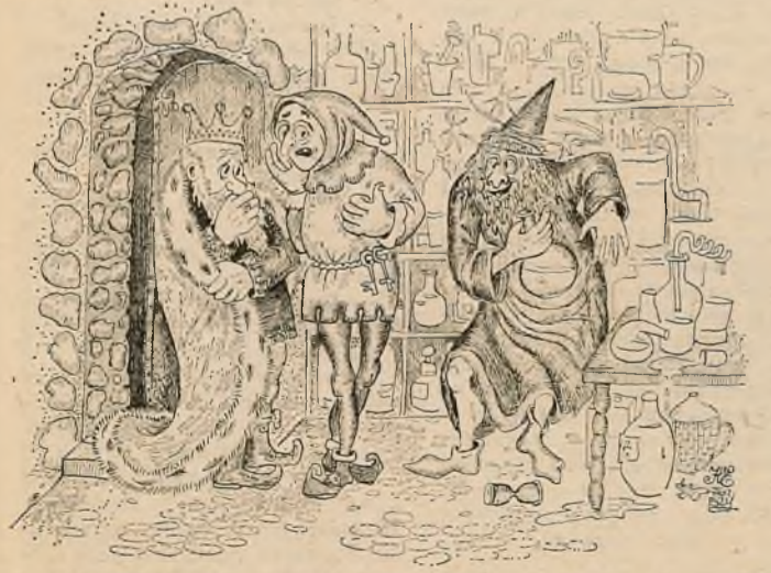
— Ваша каралеўская вялікасць, я даўно падазраваў, што ўсе гэтыя пошукі Філасофскага каменя закончацца вынаходніцтвам звычайнага самагону... (З цыкла «Той далёкі век»). Малюнк Н. ДОРАЦЬ.