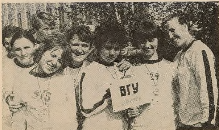
Жаночая зборная універсітэта па спартыўнаму арыентаванню.

Мінск, універсітэцкі гарадок, геаграфічны корпус, п. 14. Тэлефон 22-07-19.