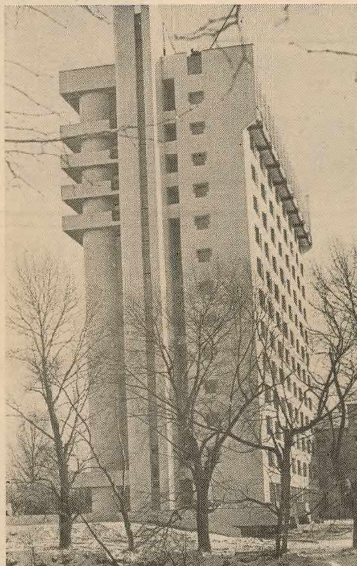
Інтэрнат № 2.

М. СТРУК, стараста I курса геафака. Р. ТЫБЕРБАЙ, прафорг.