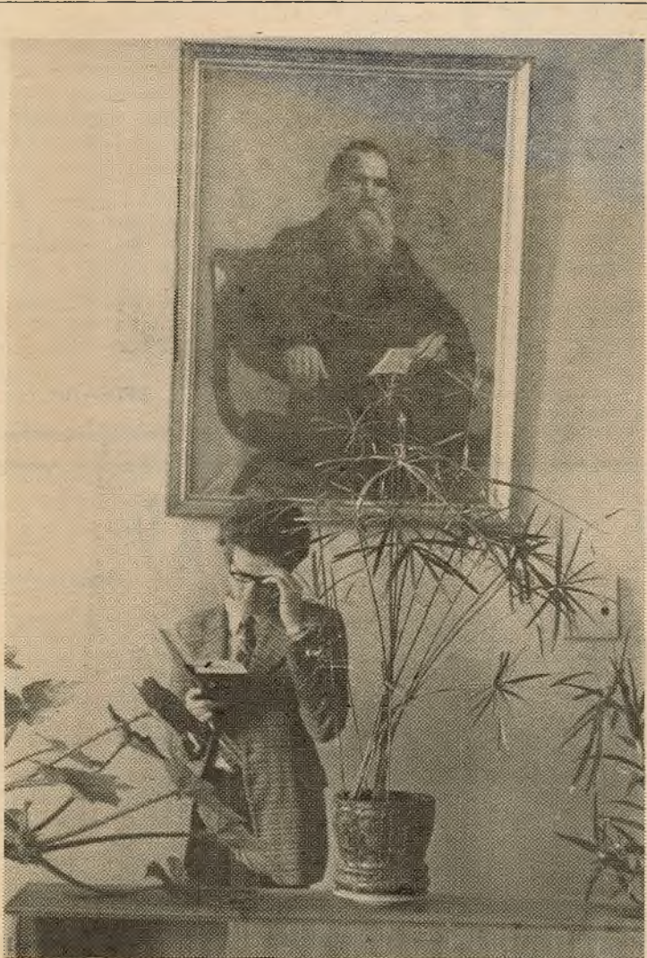
Зазірнем яшчэ раз у падручнік...