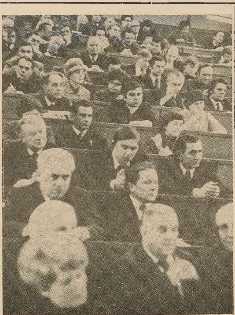
У зале сходу партыйнага актыву.

Перад калектывам нашага універсітэта стаяць важныя задачы, вынікаючыя з рашэнняў XXV з'езда КПСС, XXVIII з'езда КПБ, снежаньскага (1977 г.) Пленума ЦК КПСС. Выкананне гэтых задач у многім залежыць ад узроўню ідэйна-выхаваўчай работы сярод студэнтаў і прафесарска-выкладчыцкага саставу. Адсюль наша задача — усямерна паляпшаць у калектыве ідэйна-выхаваўчую работу. Калектыву універсітэта неабходна ўдасканальваць формы і метады гэтай работы. Галоўным зместам яе ў бліжэйшы час павінен быць наступныя кірункі — прапаганда рашэнняў XXV з'езда КПСС, XXVIII з'езда КПБ, кастрычніцкага (1977 г.) і снежаньскага (1977 г.) Пленумаў ЦК КПСС, матэрыялаў юбілейных урачыстасцей, новай Канстытуцыі СССР, падрыхтоўка да 60-годдзя ўтварэння БССР і Кампартыі Беларусі.