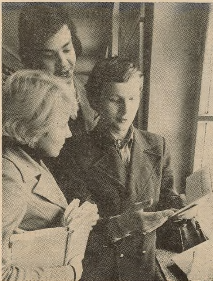
Прыемна, калі ў залікоўцы толькі добрыя і выдатныя адзнакі.