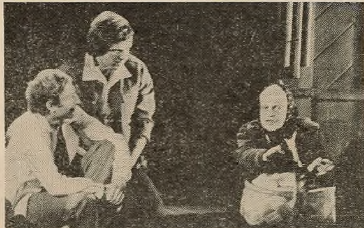
У аснову спектакля пакладзены канфлікт паміж байцамі і камандзірам СБА. Прэм'ера п'есы адбудзецца ў студзені. Рэжысёр спектакля Ю. Бяроза. На здымках: сцэны са спектакля «Блакітны экспрэс». М. ДУВОВІК. Фота аўтара.